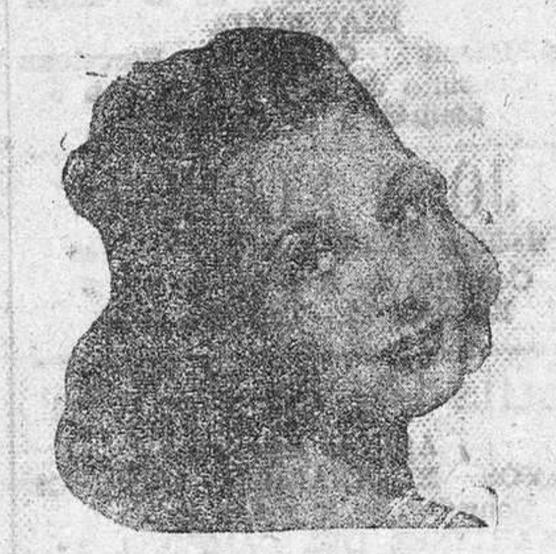
Luchi Soto Hoy en la pantalla, mañana en la escena del Principal y siempre bonita y notable actriz.