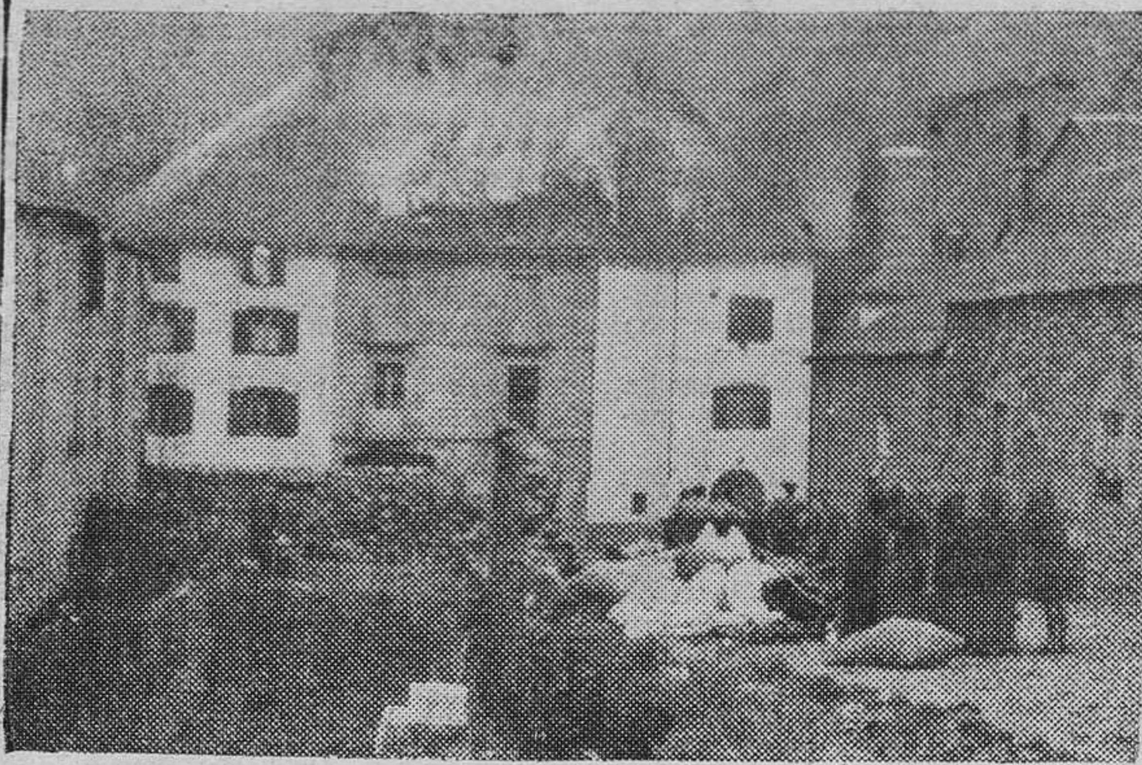
El panorama era desolador: por todas las partes, en carreteras y calles, y sacos de harina, animales, enseres de hogar, montones de forraje...