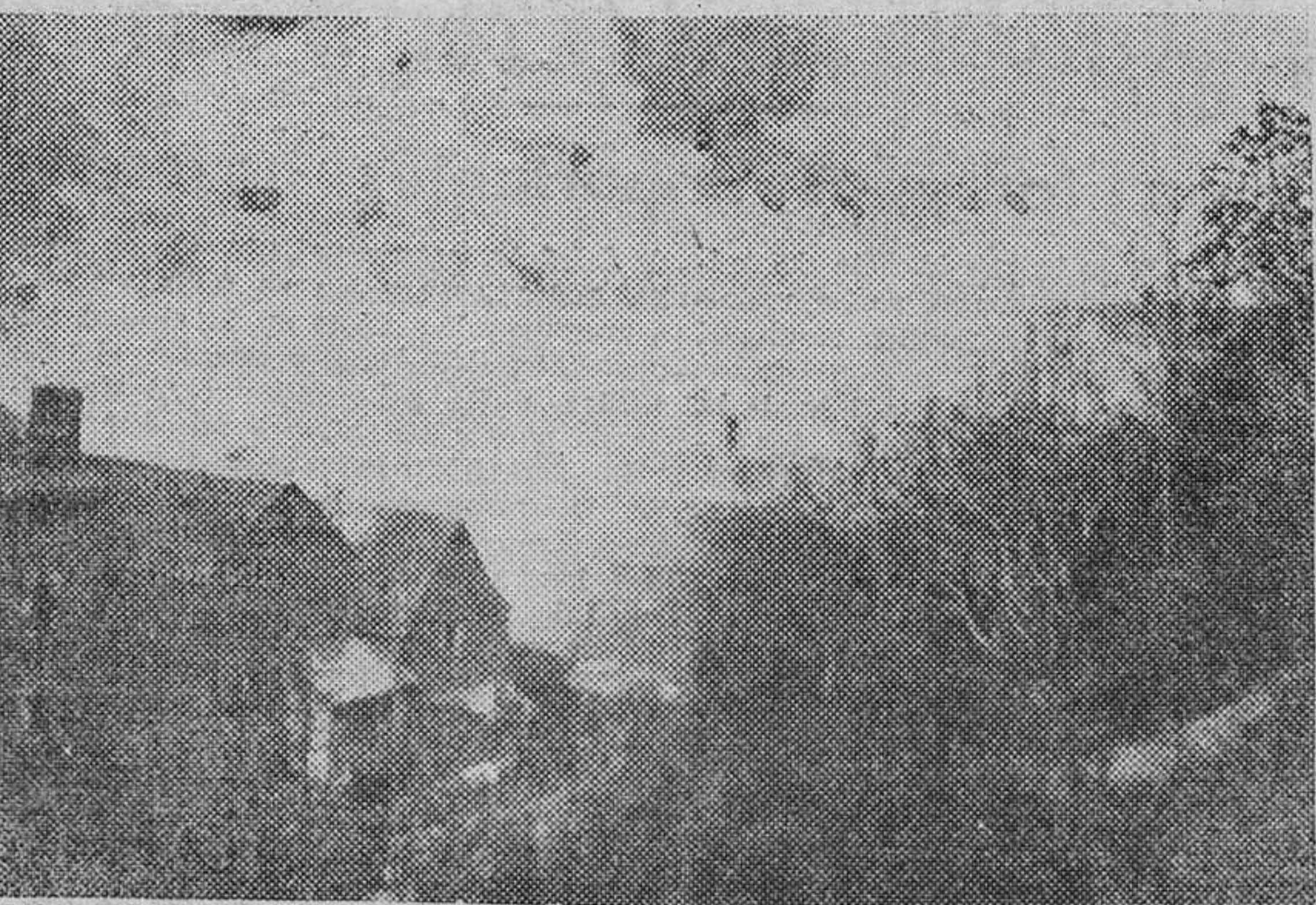
A las diez de la noche el incendio dominaba por completo el pueblo y de nada servían los auxilios de todos

Los servicios de bomberos de Huesca y Jaca que pronto aparecieron en Canfranc, ni siquiera pudieron actuar. El viento impedida su acción. De la rapidez del incendio da idea el que éste se propagara a la totalidad del pueblo en dos horas y media. La velocidad del viento era grande. Así, poco era posible hacer. Los hombres se mordían los puños de rabia ante la impotencia de los servicios contra los elementos. Era imposible intentar nada y había que dejar terminar su destructora acción a las llamas. A la una y media de la madrugada, el aire se enfureció más, las chispas llegaron en imponente profusión a los montes cercanos, prendiendo en algunos puntos. Se temió en los primeros instantes que el fuego adquiriera así nuevos y lamentables derroteros. Pero merced al estado de verdor del campo no tuvieron confirmación los temores que se abrigaron en este aspecto.