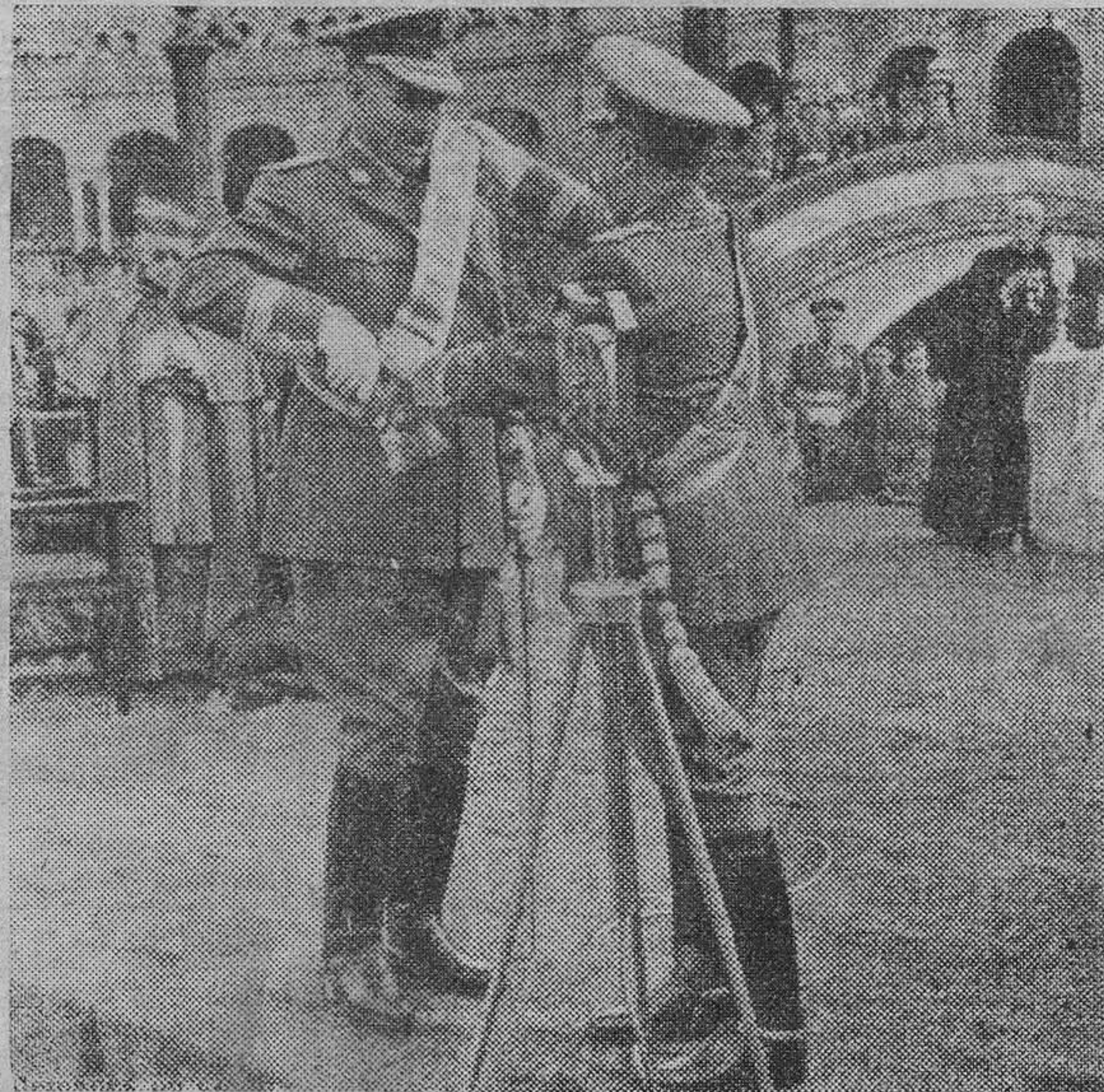
S. E. el Generalísimo impone la Gran Cruz Laureada de San Fernando al teniente general Queipo de Llano en Sevilla.