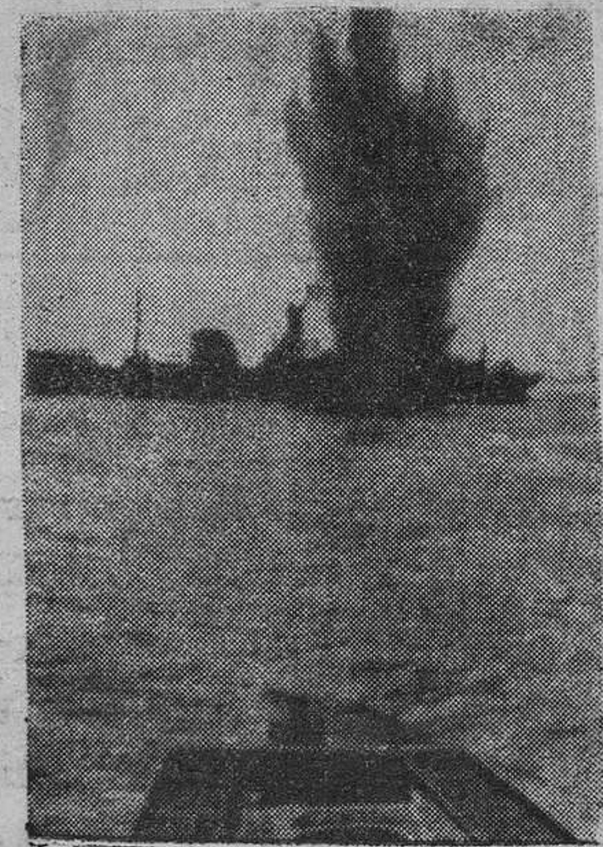
La interesante fotografía que ofrecemos a nuestros lectores reproduce el momento en que un torpedo lanzado por un submarino alemán hace explosión en un transporte enemigo.

Berlín.—Durante el ataque efectuado el miércoles por la noche por la aviación británica contra el centro de Francia se produjeron varios incidentes, que demuestran el desorden que cundió entre las formaciones aliadas por causa de la caza nocturna alemana, según dice el redactor aeronáutico de la Agencia D. N. B.