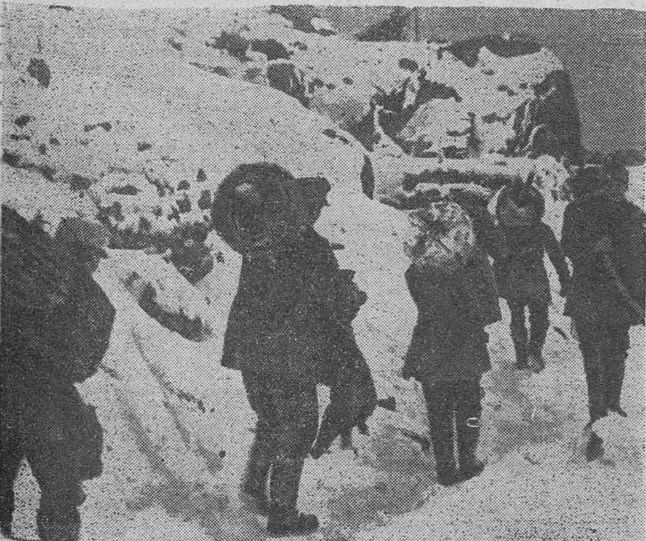
Soldados alpinos del frente de Murmansk transportan el alambre para que los zapadores alemanes fortifiquen las posiciones defensivas ante los bolcheviques