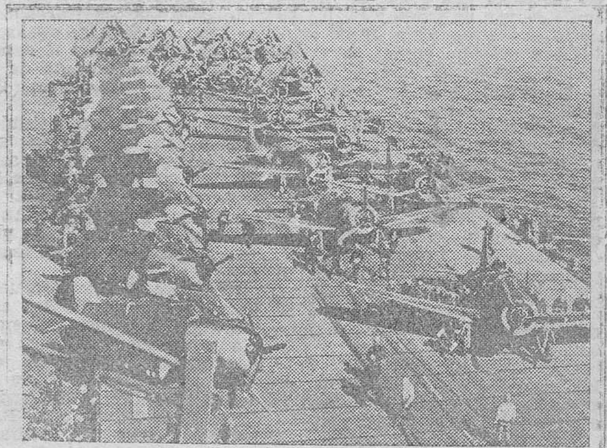
La cubierta de vuelo de este nuevo portaaviones americano, que fué antes un crucero ligero, atestado de cazas Wildcat, bombarderos Dauntless y torpederos Avenger