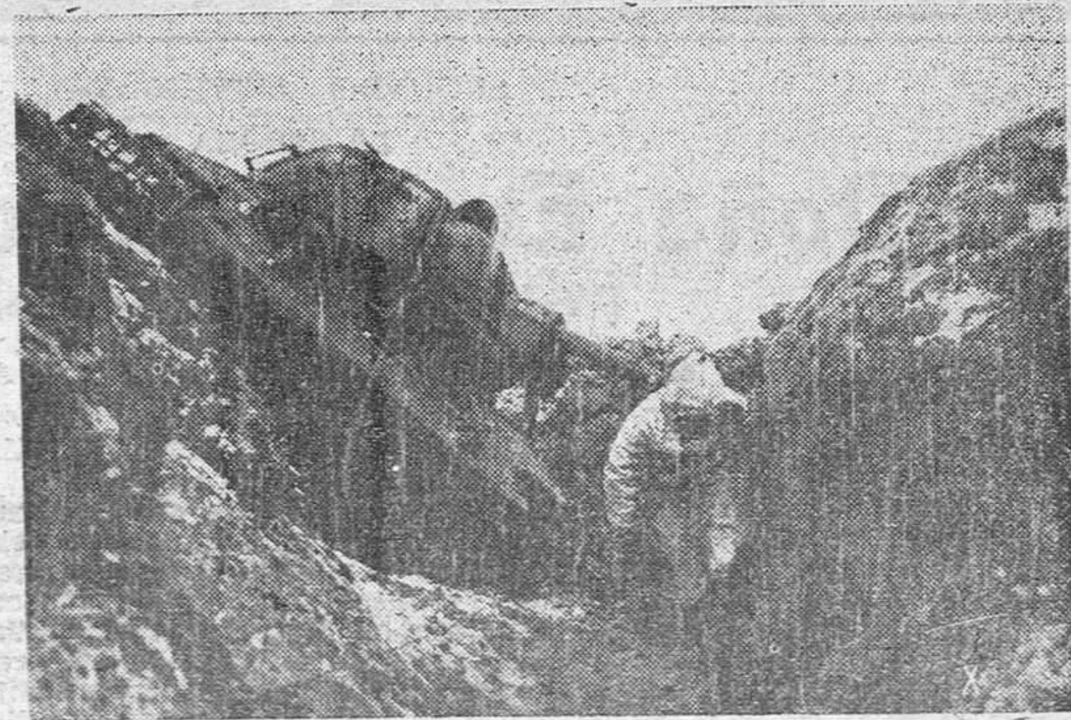
En un ataque de los tanques soviéticos uno de estos fue alcanzado de lleno por la explosión de una mina, acabando su carrera en el fondo de una trinchera y quedando en la forma que nos muestra la foto