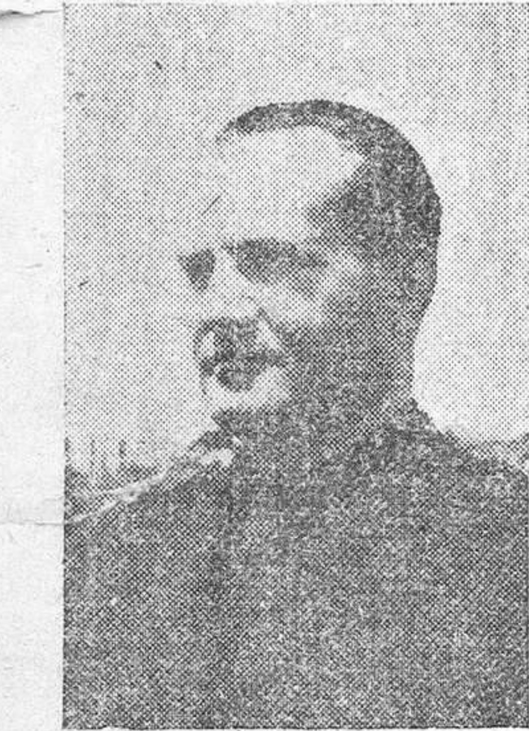
El Ministro de Industria

A continuación habló el alcalde, quien ofreció al Caudillo y a España el fruto de este esfuerzo de voluntad y laboriosidad.