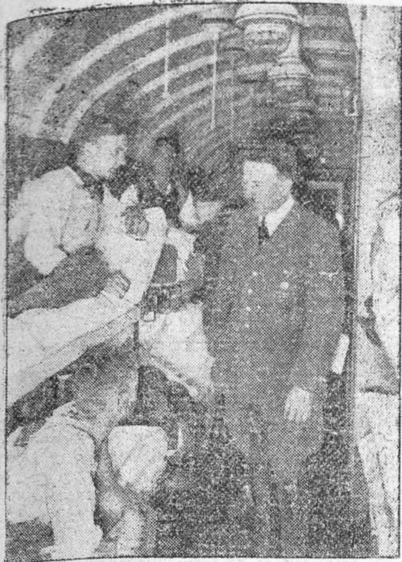
En el día de la Cruz Roja Alemana, dando ejemplo a la llamada del Führer a todo el pueblo alemán, aquél visita un tria hospital y conversa con los heridos