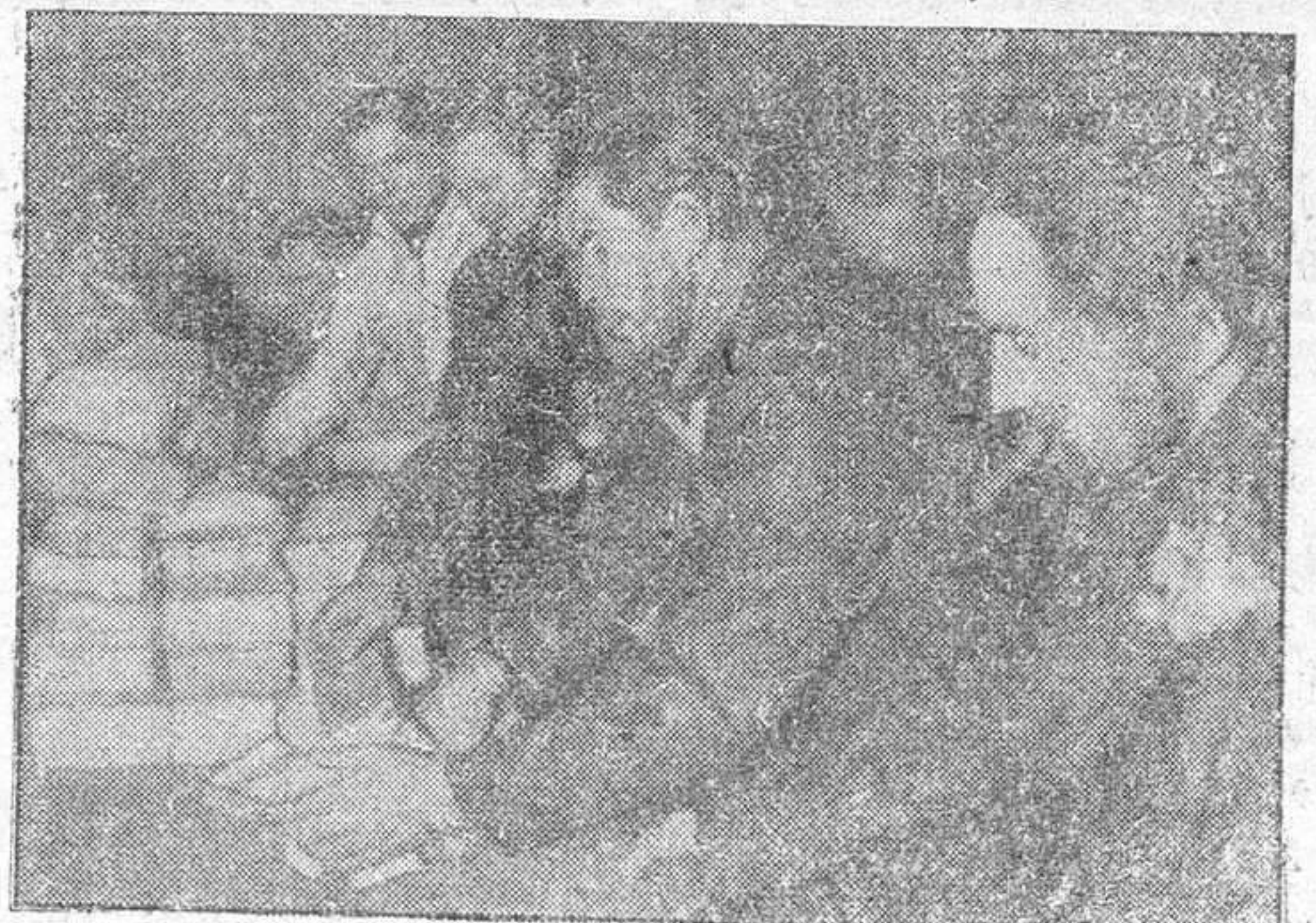
La tripulación de un submarino alemán que ha regresado de nuevo a su punto de partida, recoge con la mayor alegría el correo que durante su ausencia han recibido.