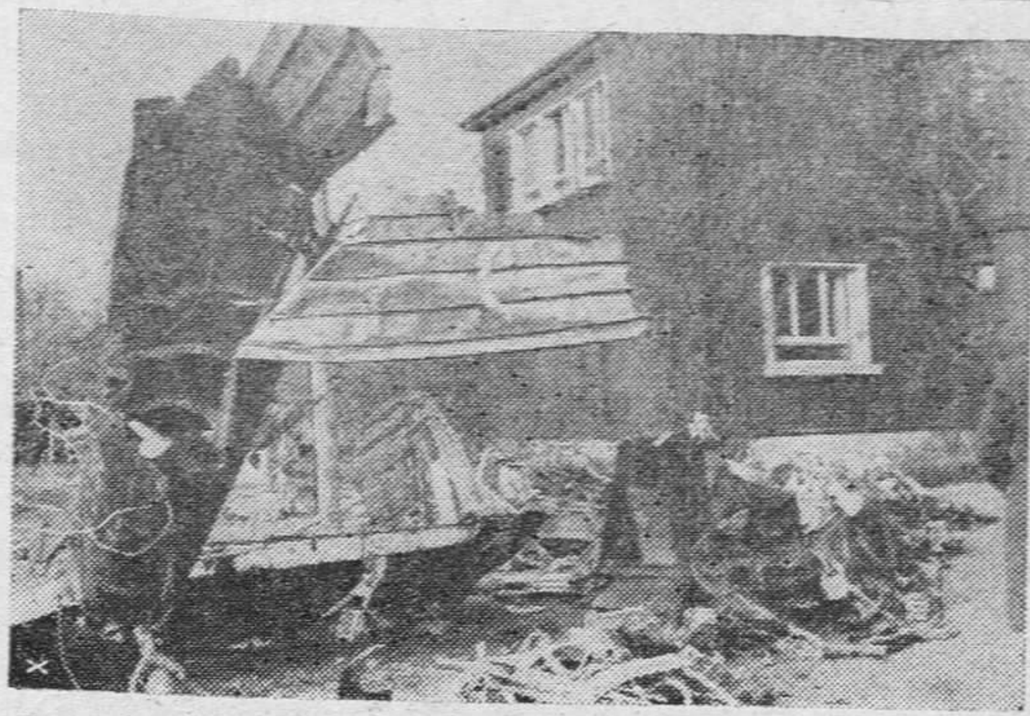
Las incursiones en territorio alemán se hacen cada vez más peligrosas para la aviación inglesa. He aquí los restos de uno de los aparatos derribados últimamente.