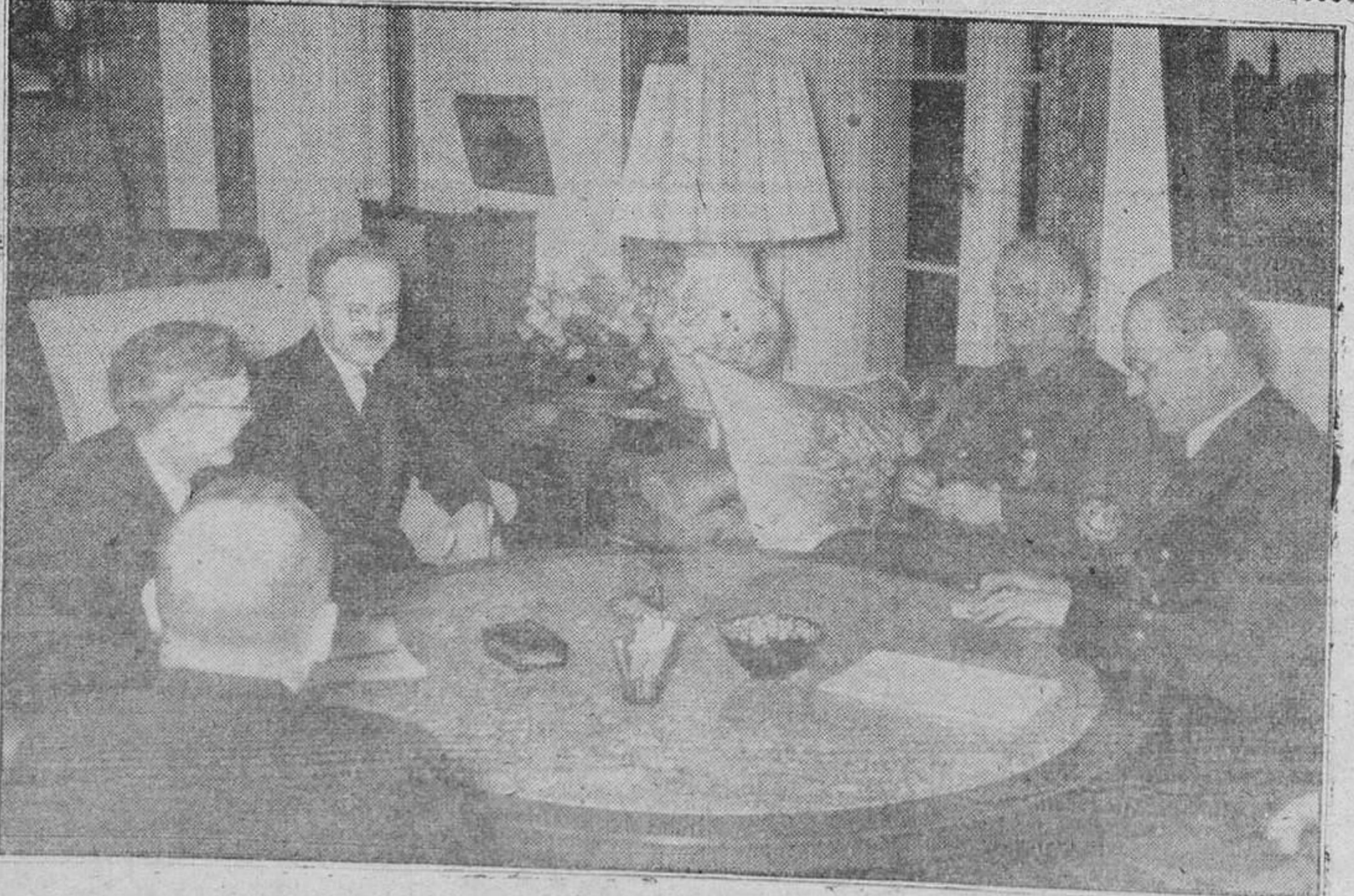
El Comisario del Exterior de Rusia, Molotov, estuvo en Bruselas y estableció importantes entrevistas. Aquí, en la foto, cuando fué recibido por Von Ribbentrop, en el Ministerio de Negocios Extranjeros de la Weimarsburg.