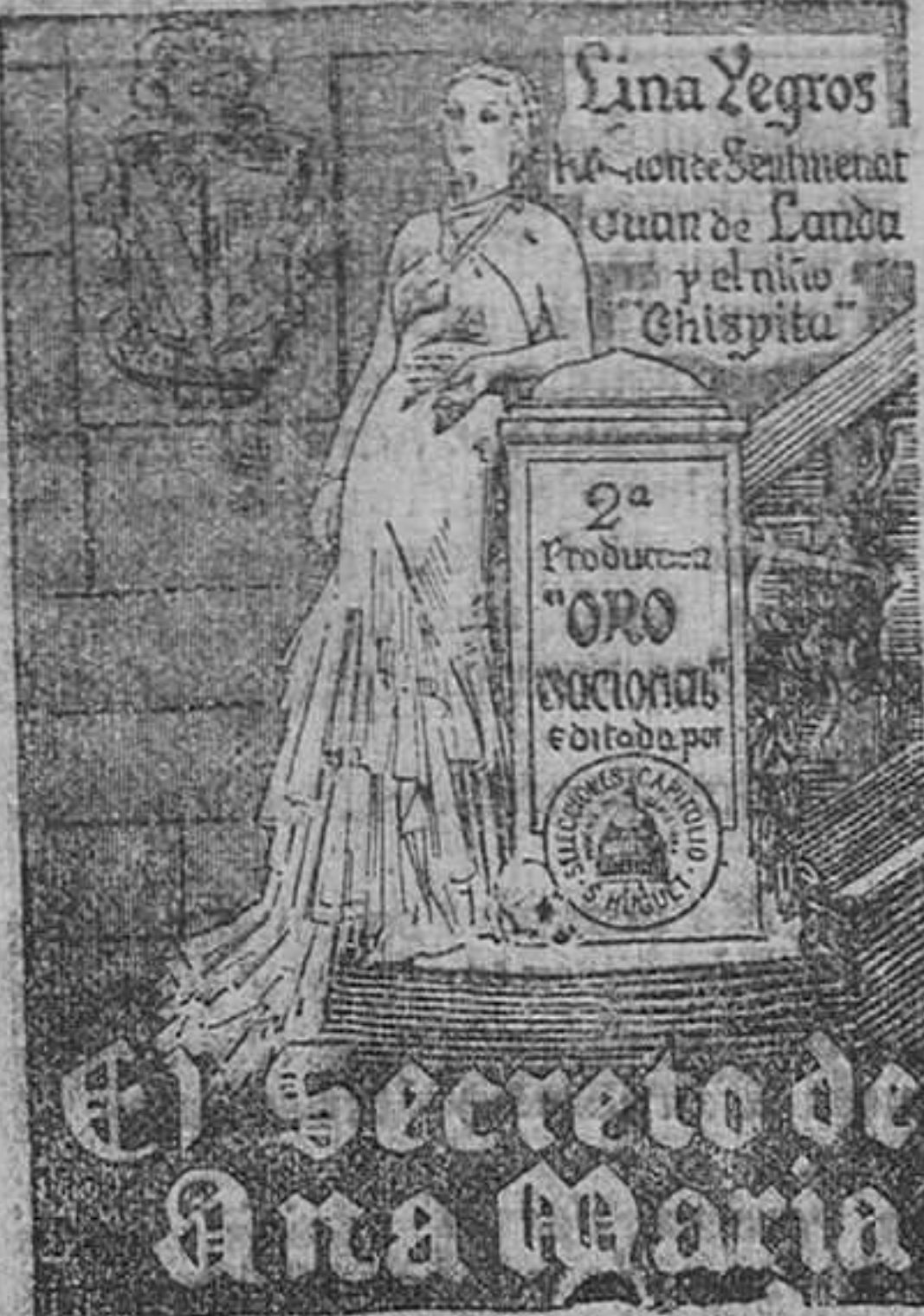
El Secreto de Ana María

Mañana, domingo, a las cinco, siete y tres cuartos y diez y tres cuartos