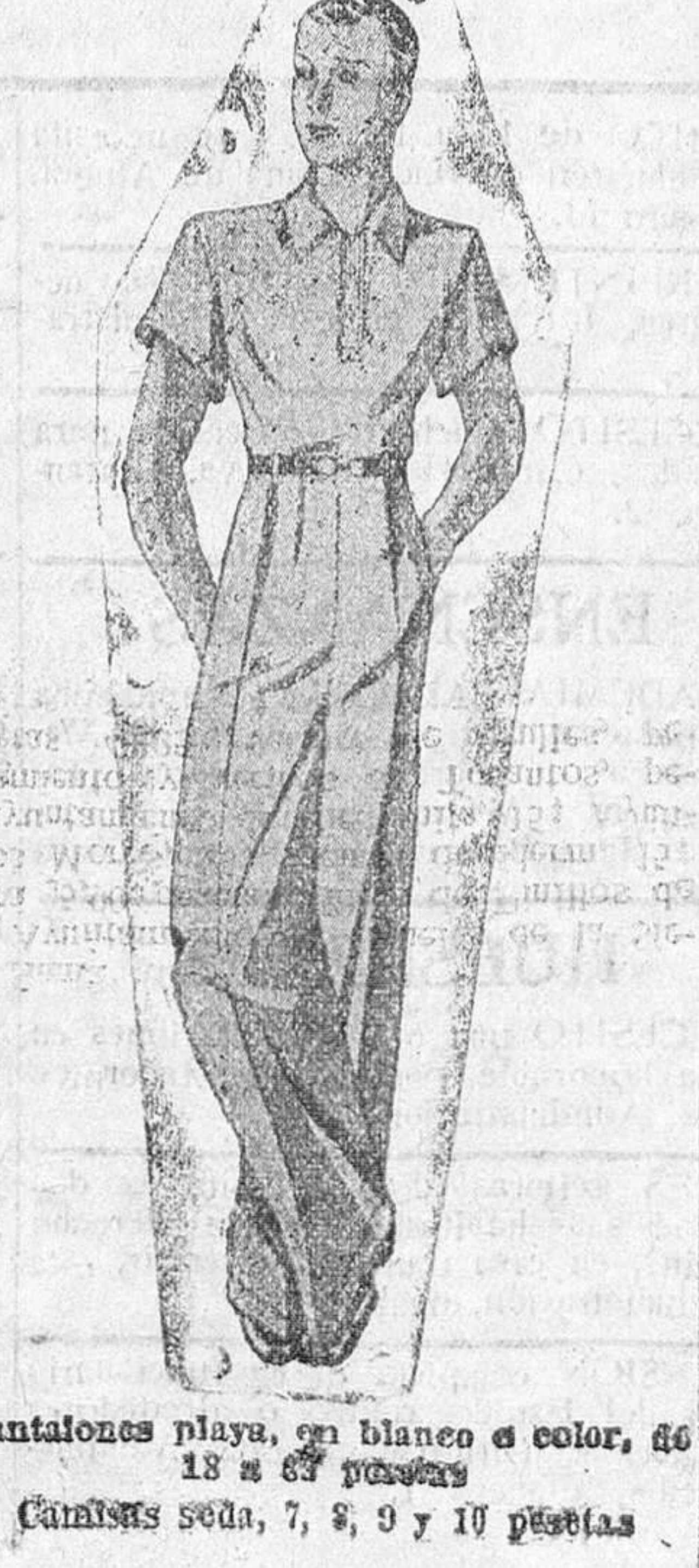
Pantalones playa, en blanco o color, de 15 a 65 pesetas