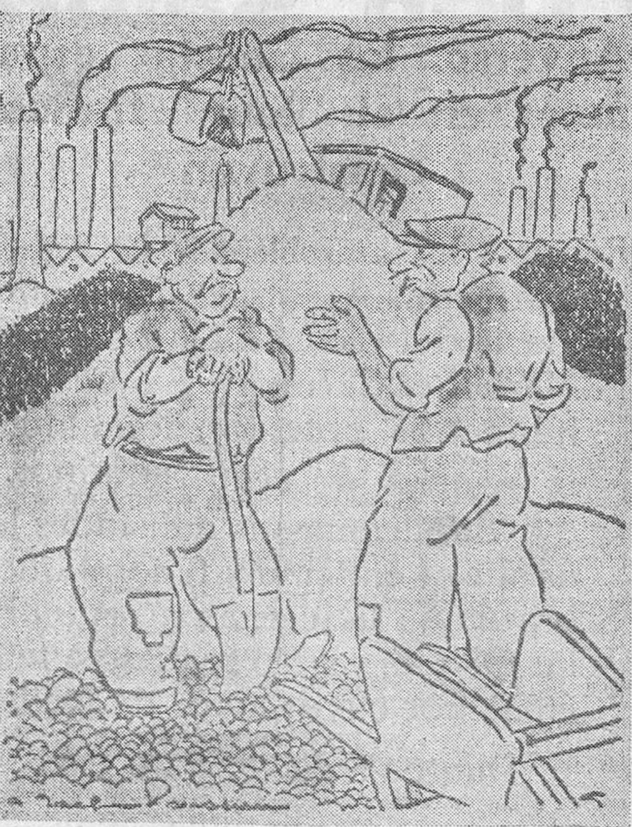
—Aquí donde me tienes, mi padre ocupó una posición muy elevada. —Pues el mío fué uno de los hombres que más ruido han metido en el mundo. —¿Qué fué tu padre? —Tocaba el bombo en un regimiento, y el tuyo? —Era campanero de la catedral.