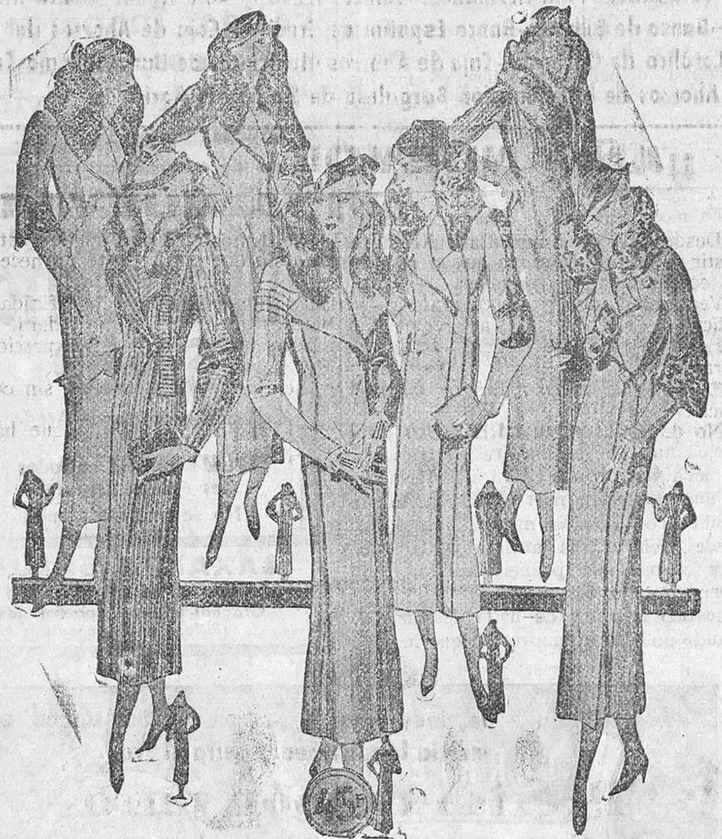
Abrigos para señora, modelos novedad, corte perfecto y confección esmerada a 20, 25, 30, 35, 40, 50, 60, 70 y 80 pesetas.