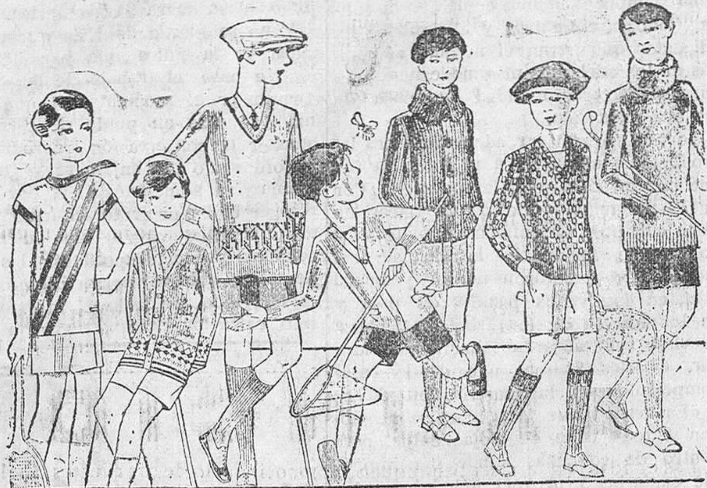
Gerseys junto, para niño, diversidad de dibujos y colores A 4, 5, 6, 7, 8 y 10 pesetas

PAÑERIAS - SASTRERIAS - CALZADOS SEGARRA