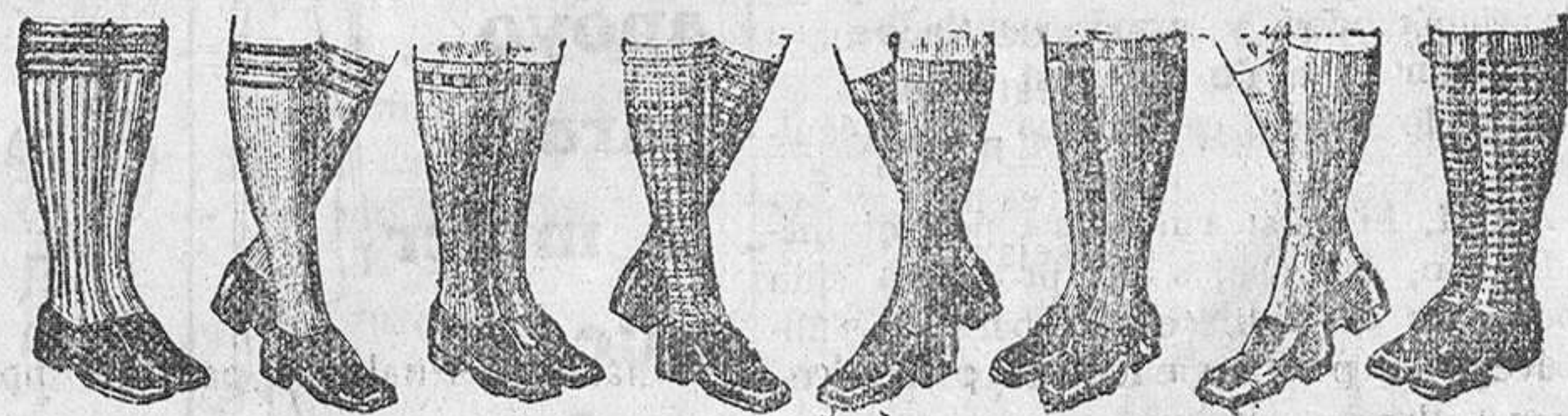
Medias sport, dibujos novedad, a 1, 1'50, 2, 2'50, 3 y 4 pesetas