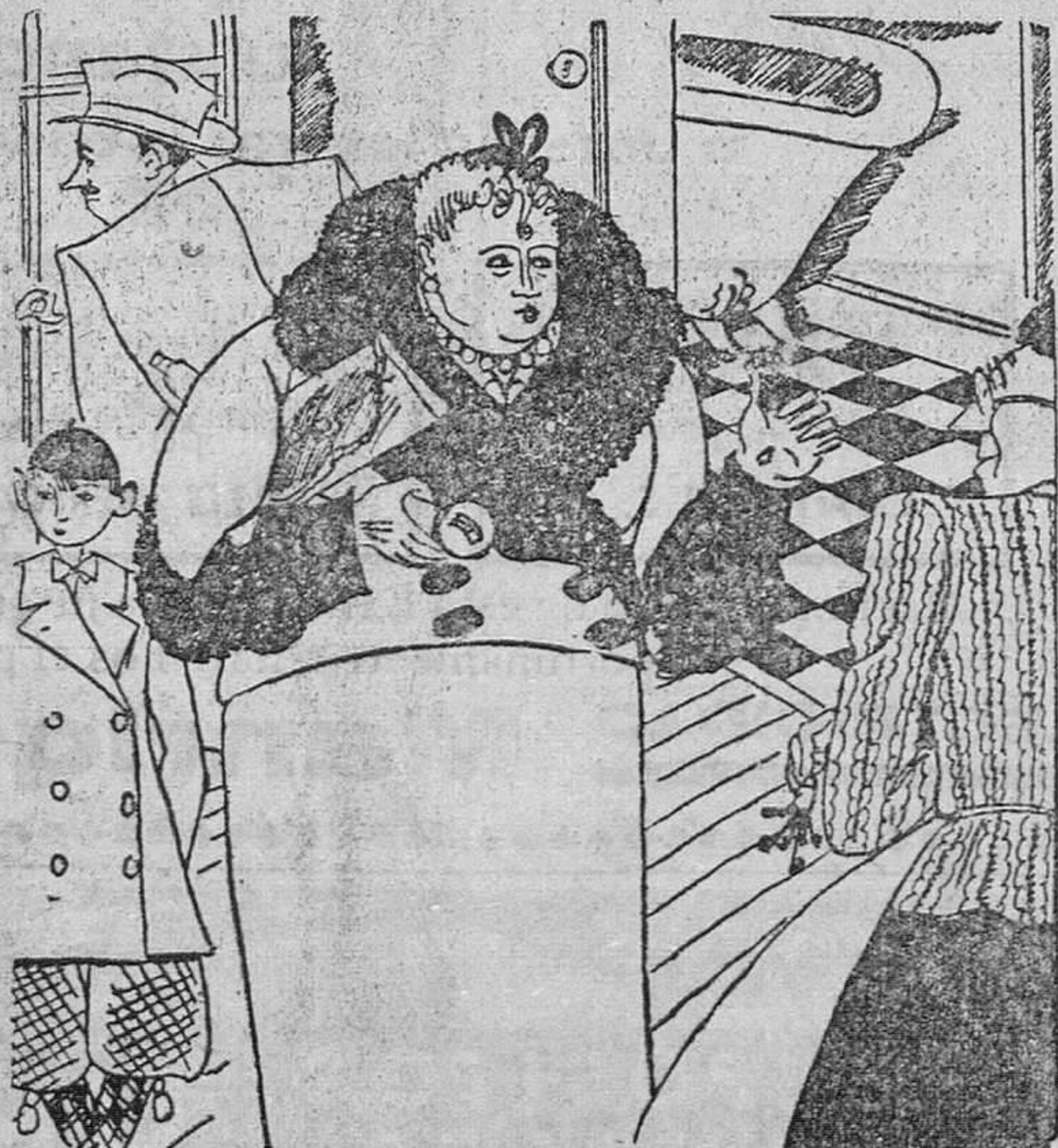
—El cuarto de baño no nos interesa. Vamos a una playa todos los veranos.