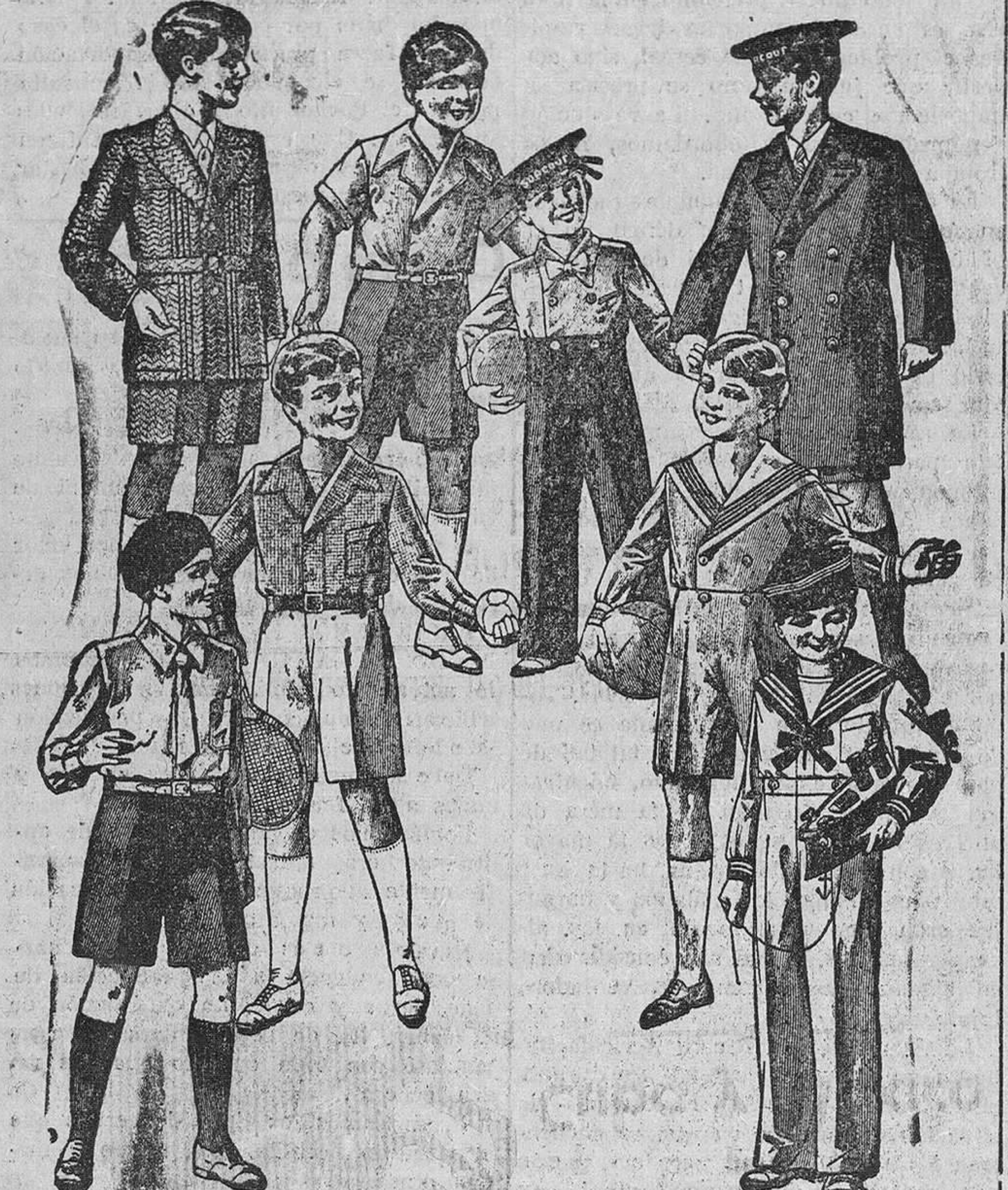
Cuarenta modelos distintos de trajes en jergas, lanas y paños, para niños de 5 a 10 años, desde 20 a 60 pesetas. La casa que más barato vende y más surtido presenta Sección especial a la medida