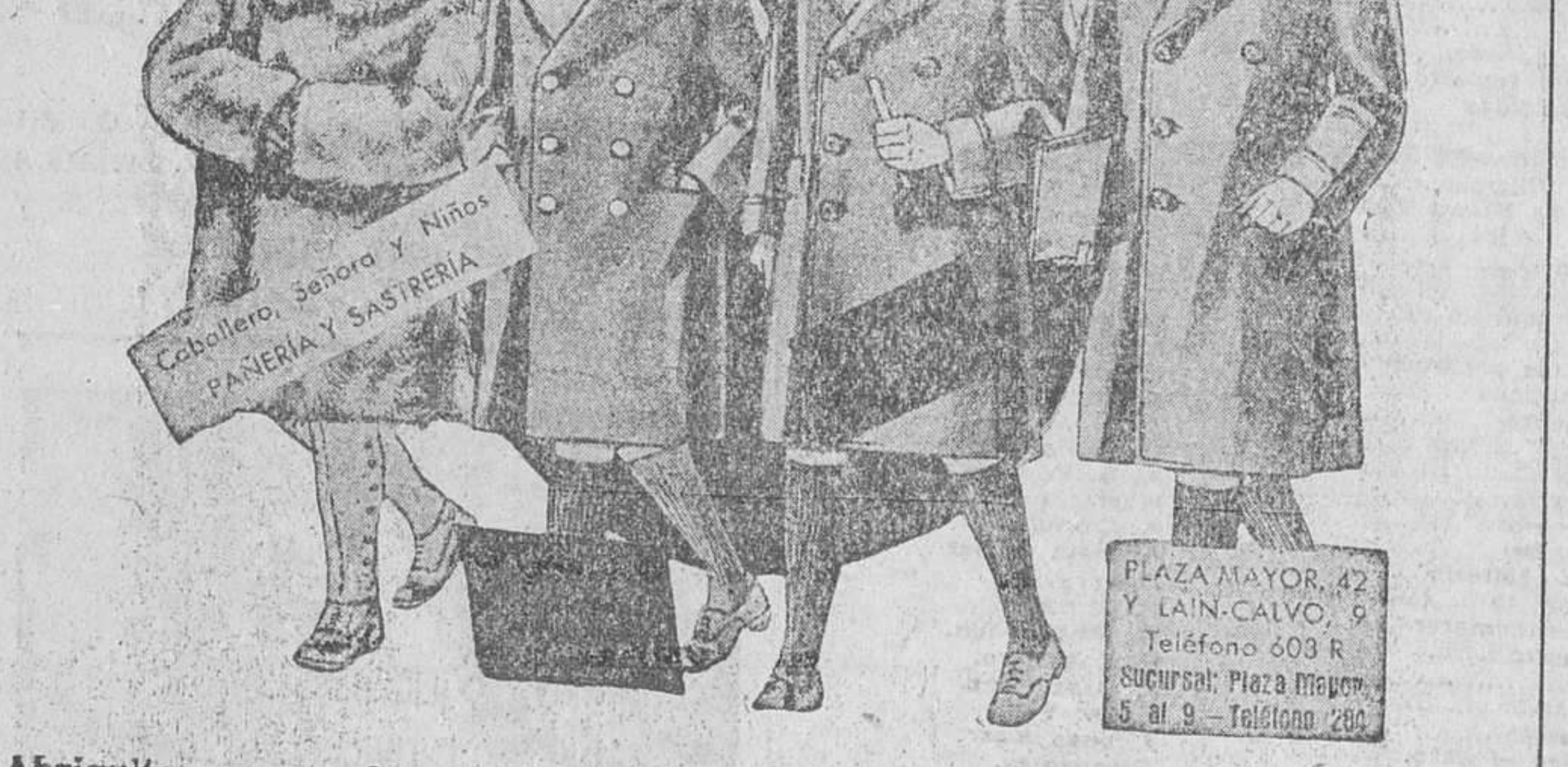
Abriguitos para niños, modelos novedad, de 15, 18, 20, 25 y 30 pesetas.

Primera casa en confecciones para caballero, señora y niños Plaza Mayor, 42. Lain-Calvo, 9 y 11.—Sucursal: Plaza Mayor 8 Burgos. Teléfono, 623-17. Teléfono, 882