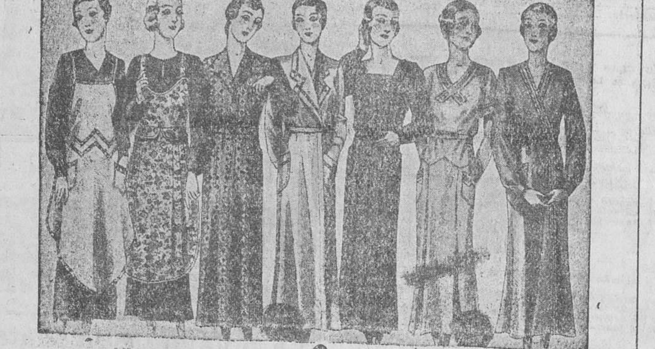
Batas y uniformes, todos los gustos, diversidad de modelos, de 8, 10, 12 y 15 pesetas.