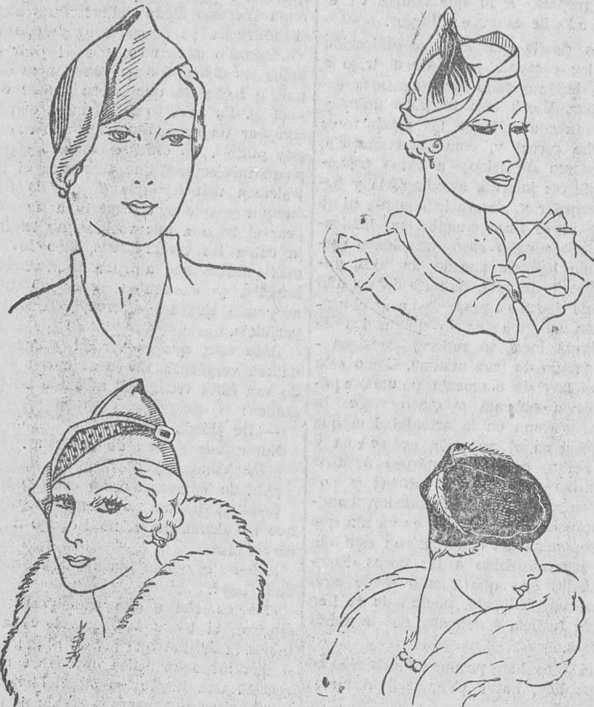
Algunos de los modelos que presenta en la actual temporada