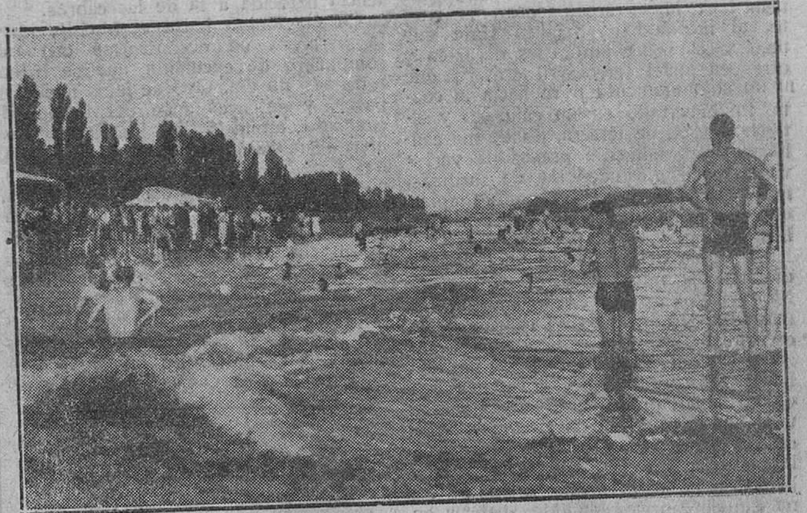
En las procelosas olas de nuestro modesto río, encuentran los burgaleses un lenitivo a los excesivos cafores de este verano y rinden culto a la higiene