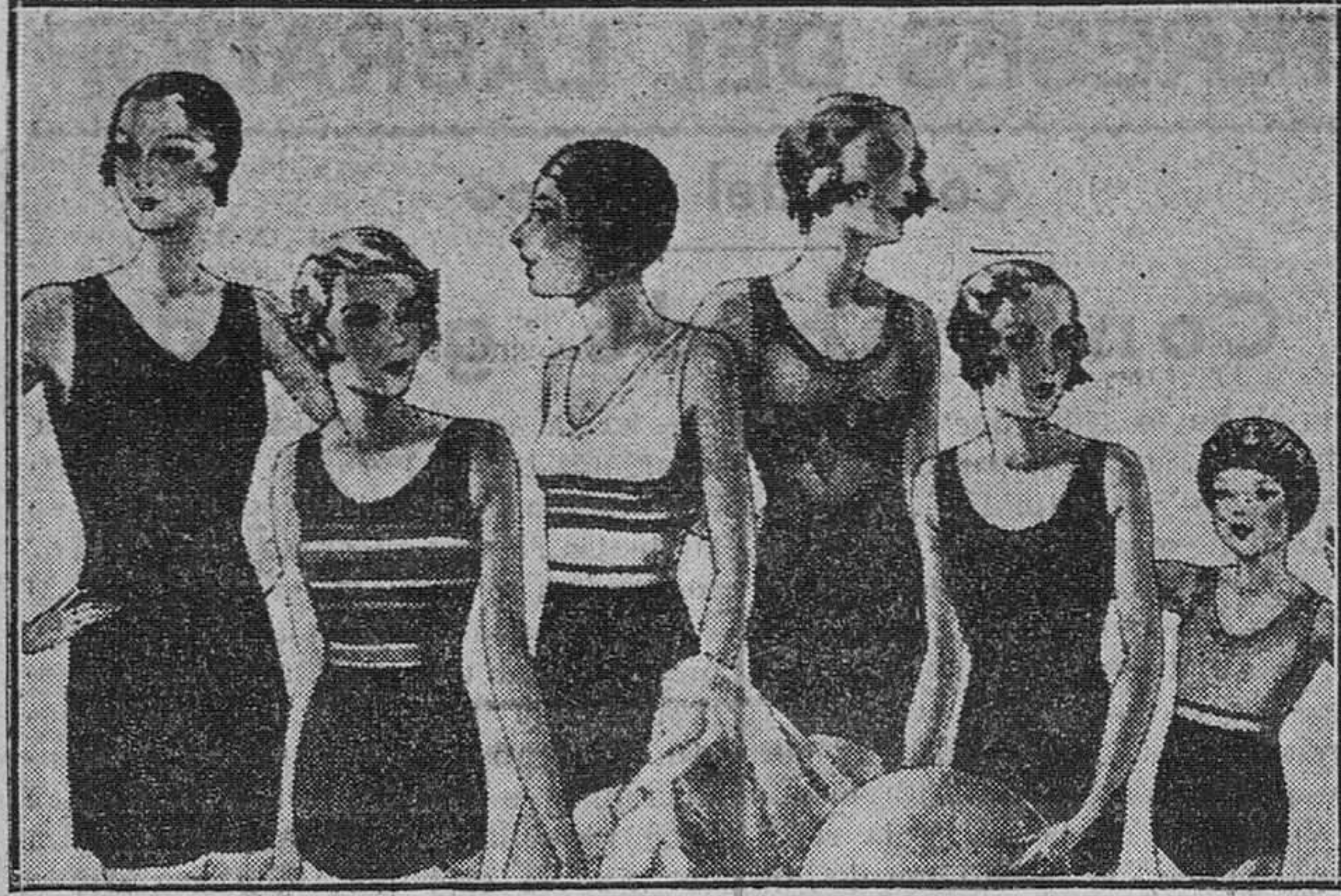
Trajes de baño en lana o algodón para señora, caballero o niños Pantalón de baño a 1,50, 1,75, 2 y 2,50

Primera casa en confecciones para caballero, señora y niños Plaza Mayor, 43. LAIN-CALVO, 9 y 11.—Sursual: Plaza Mayor, 6, Burgos