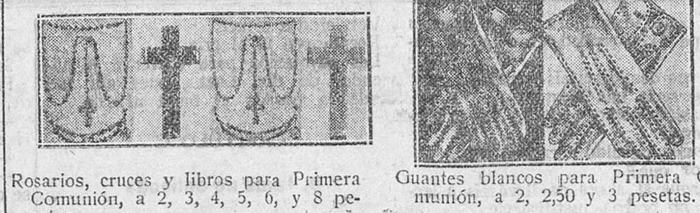
Rosarios, cruces y libros para Primera Comunión, a 2, 3, 4, 5, 6, y 8 pesetas. Guantes blancos para Primera Comunión, a 2, 2,50 y 3 pesetas.

La Casa que más surtido presenta y más barato vende Suscríbese a la emocionante novela, original de Luis de Val, titulada 'MALDITA'