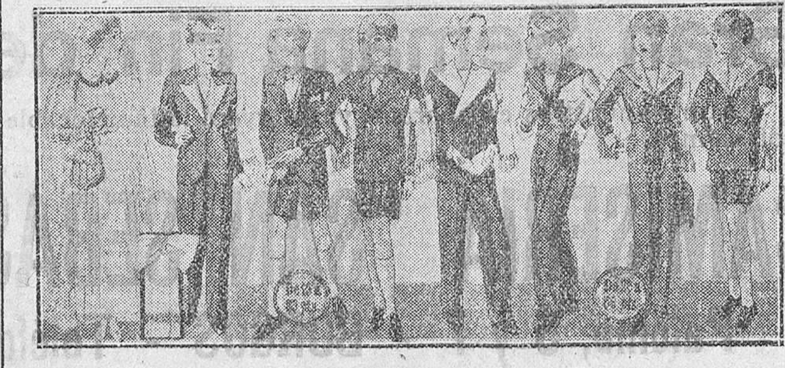
Diversidad de modelos de trajecitos para Primera Comunión, en lana blanca, lana gris y en azul, a 20, 25, 30, 40 y 50 pesetas.

Primera casa en confecciones para caballero, señora y niños Plaza Mayor, 42. Lain-Calvo, 9 y 11.-Sucursal: Plaza Mayor, 6, Burgos