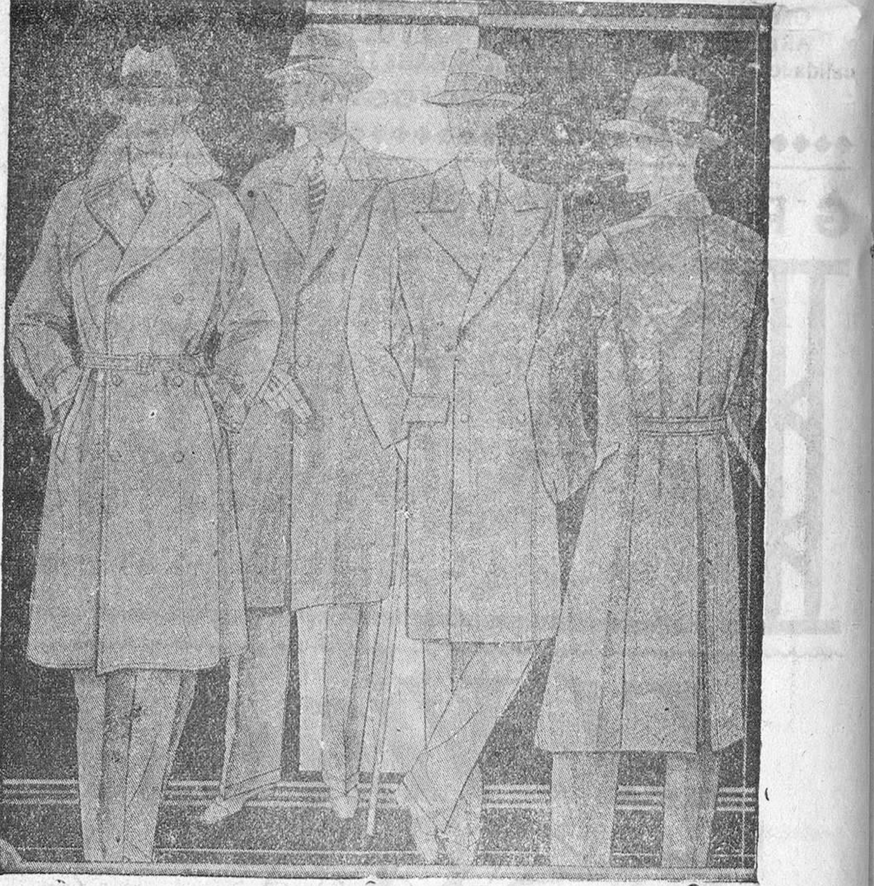
Abrigos novedad, corte moderno desde 35 pesetas a 200 uno. Colores y dibujos modernos.

Casa Munguía Primera casa en confecciones para caballero, señora y niños Plaza Mayor, 48. Lain-Calvo, 9 y 11.-Sucursal: Plaza Mayor, 5, Burgos