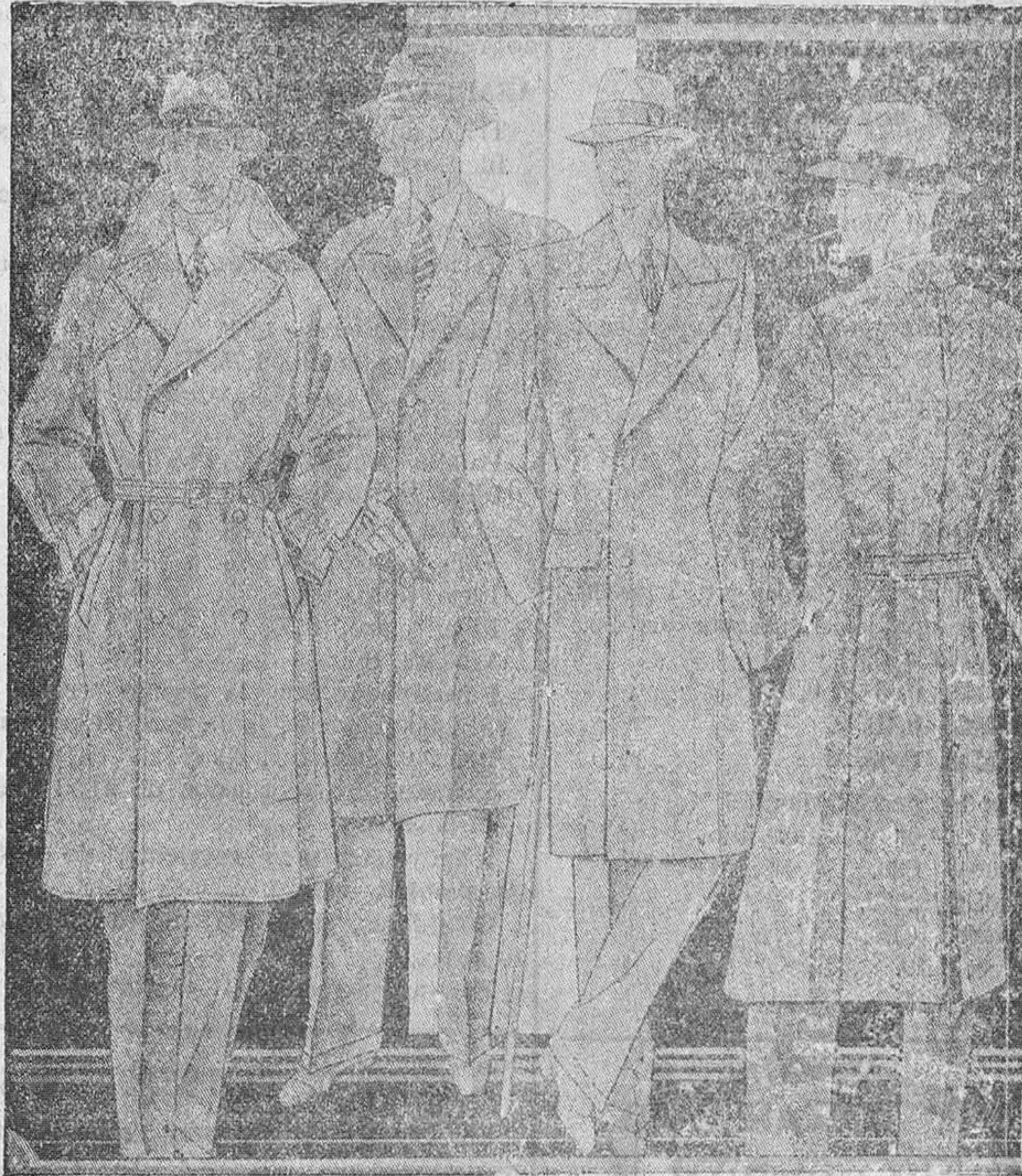
Abrigos novedad, corte moderno desde 35 pesetas a 200 uno. Colores y dibujos modernos.

Plaza Mayor, 42. Lain-Calvo, 9 y 11.-Sucesal: Plaza Mayor, 6, Burgos