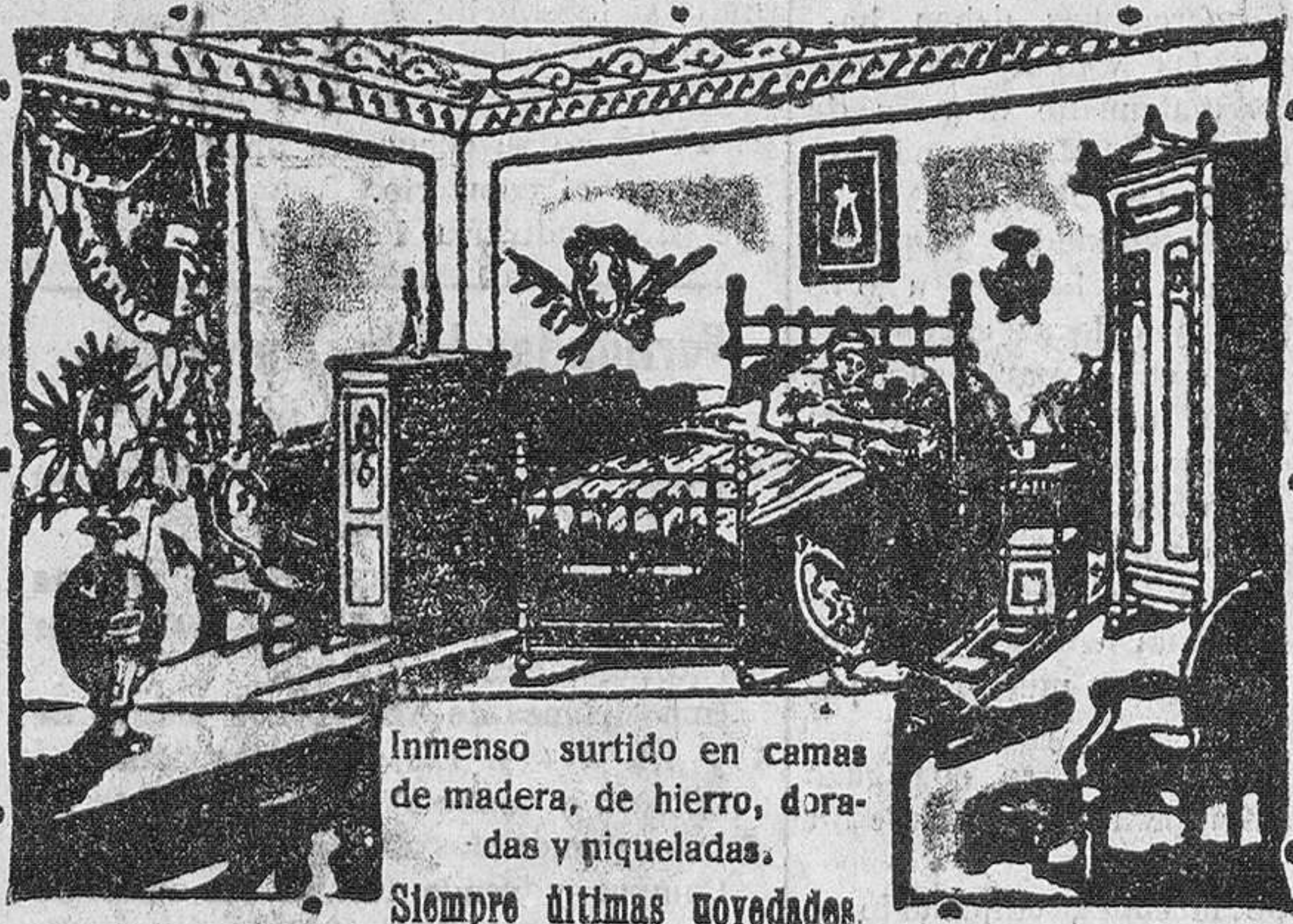
Inmenso surtido en camas de madera, de hierro, doradas y piqueladas. Siempre últimas novedades.

Calle de Vitoria, número 14.---BURGOS En esta Casa se vende el sommier "Numancia"