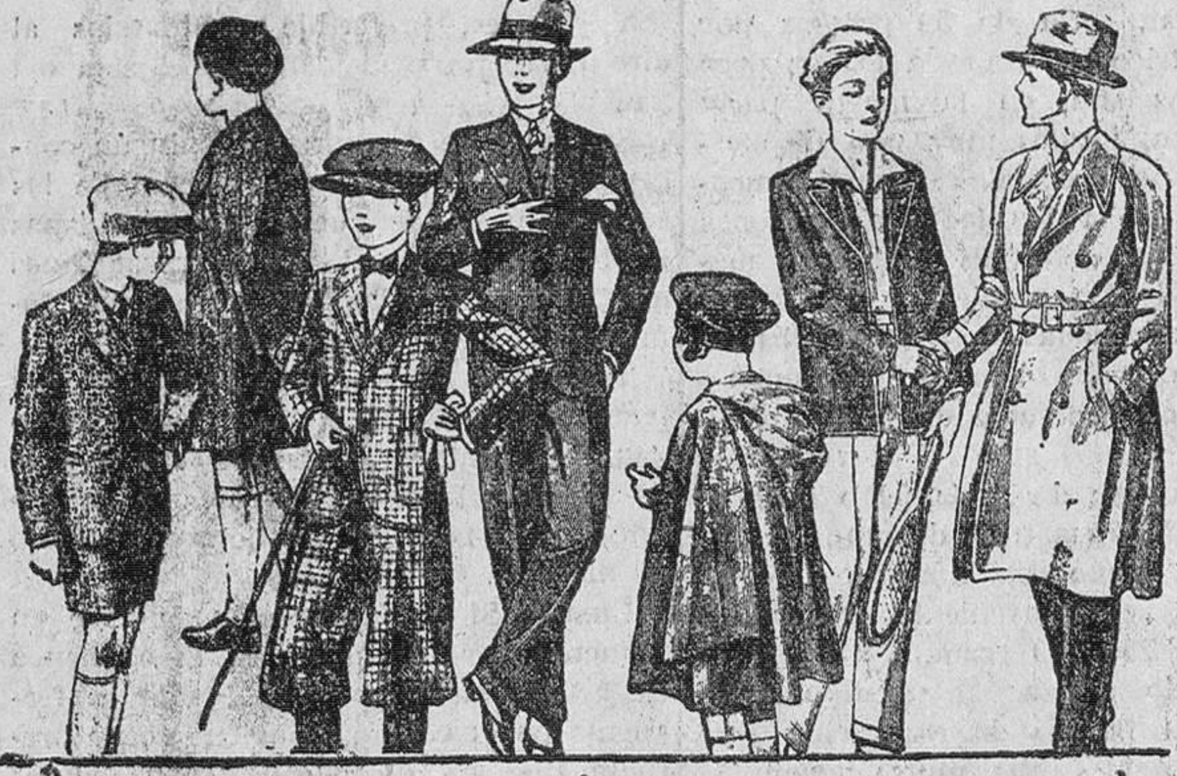
Abrigos y trajes de paño, modelos nuevos de 20, 25, 30, 35, 40 y 50 pesetas

Primera casa en confecciones para caballero, señora y niños Plaza Mayor, 42. Lain-Calvo, 2 y 4. - Sucursal: Plaza Mayor, 6, Burgos