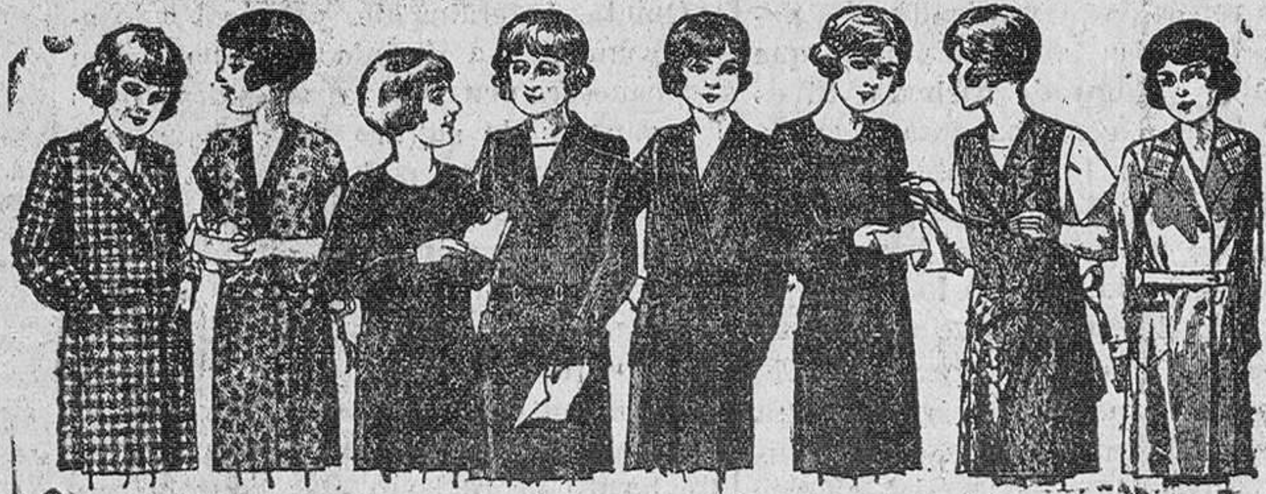
Vestiditos para niñas de 8 a 14 años, en crepón, seda o lana, de 12, 15, 18, 20 y 25 pesetas.

¿Quiere comprar camas y muebles de toda confianza a precios baratísimos?