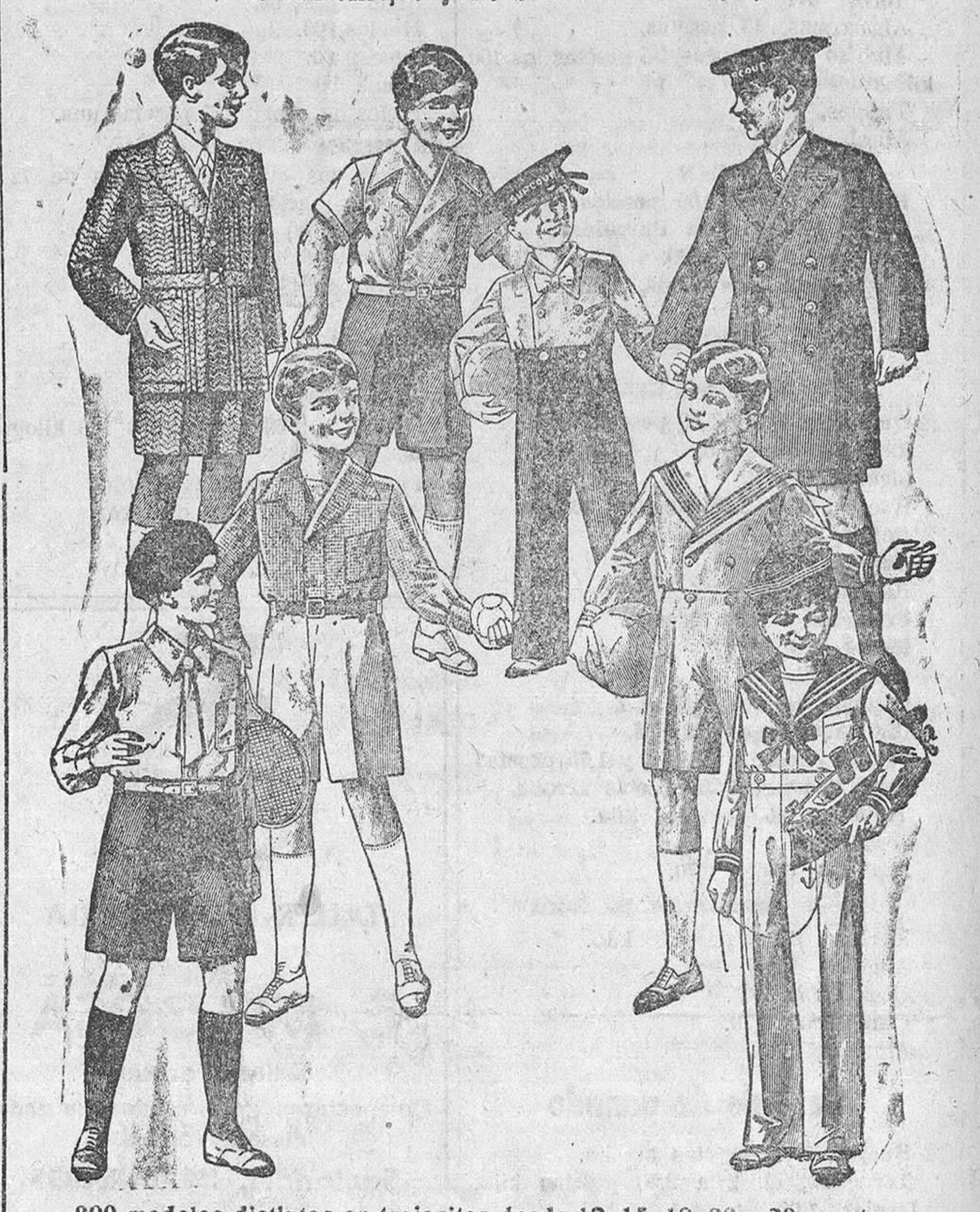
200 modelos distintos en trajecitos desde 12, 15, 18, 20 y 30 pesetas.

Primera casa en conexiones para caballero, señora y niños