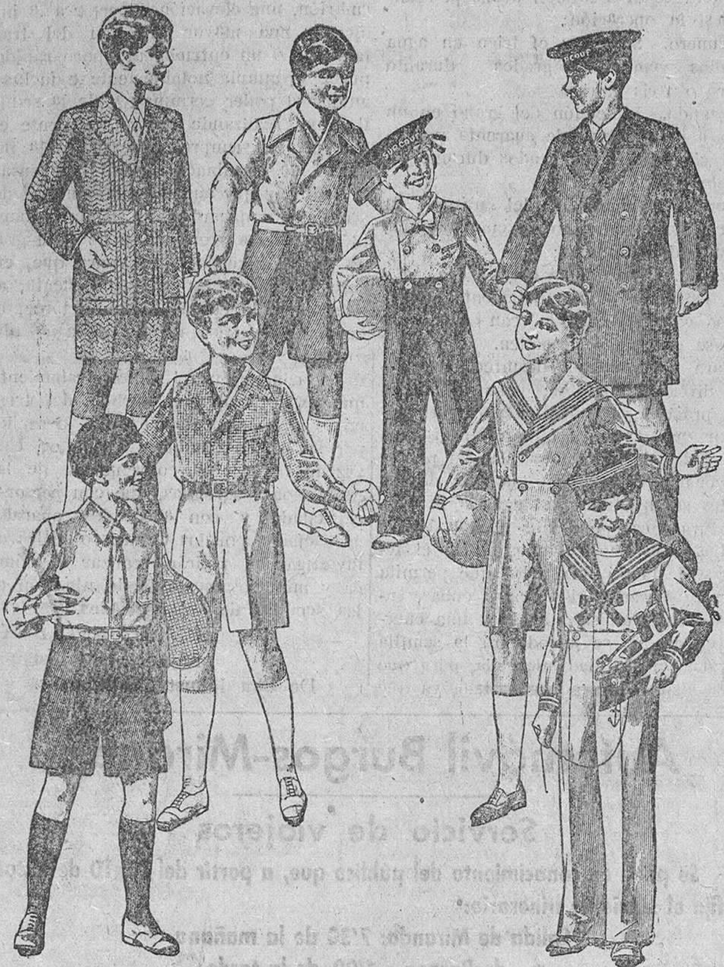
200 modelos distintos en trajes de 12, 15, 18, 20 y 30 pesetas.

Primera casa en confecciones para caballero, señora y niños Plaza Mayor, 42. Lain-Calvo, 9 y 11. Sucursal: Plaza Mayor, 5, Burgos