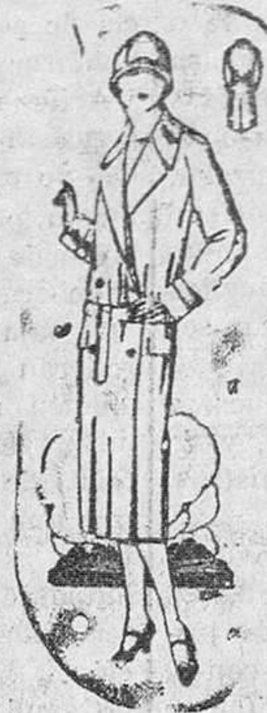
Abrigos para señora corte moderno a 20, 25, 40 y 50 pesetas