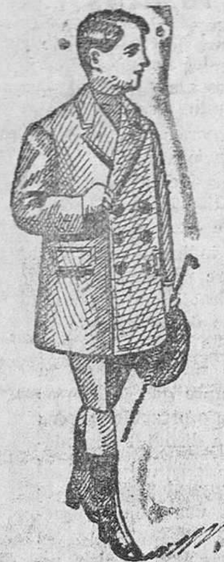
Abrigos novedad para niños, a 15, 20, 25 y 30 pesetas

Establecimiento oficial del Turing Club Español