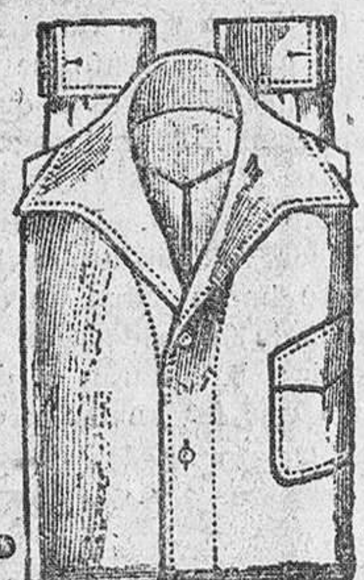
Camisas sport, blanco, crudo y colores, para caballero y jovencitos, a 4, 5, 6, 7 y 10 pesetas.