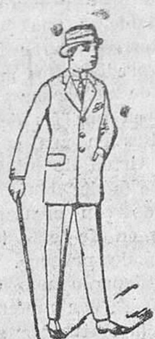
Tropes para caballero de de 40 a 115 pesetas Corte moderno