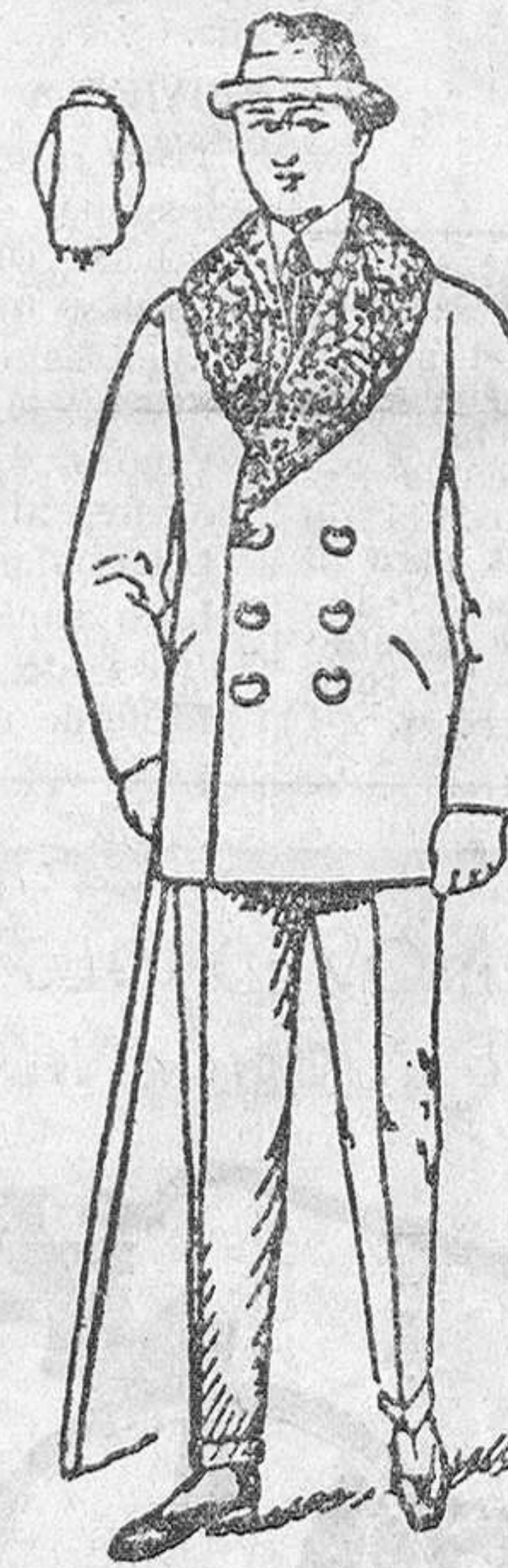
Pelizzas cuello rizo en pañ. castor desde 20 a 125 pesetas