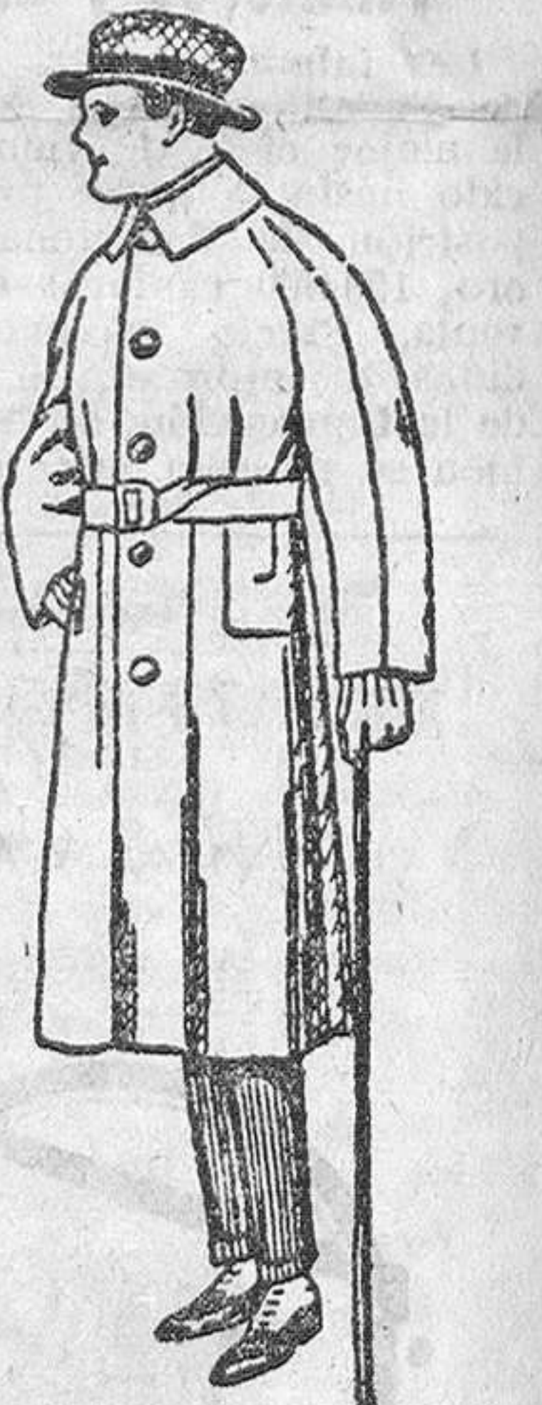
Trincheras desde 25 a 100 pesetas