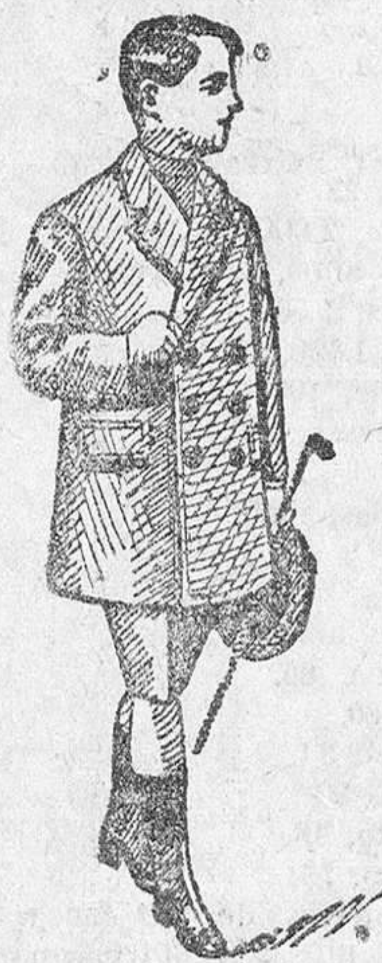
Abrigos novedad para niños, a 15, 20, 25 y 30 pesetas

para caballero, señora, jóvenes y niños SASTRERIA Y PAÑERIA TELEFONO 603 R Establecimiento oficial del Turing Club Español