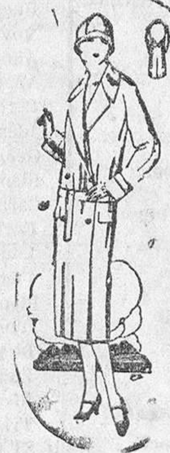
Abrigos para señora corte moderno a 23, 25, 40 y 50 pesetas