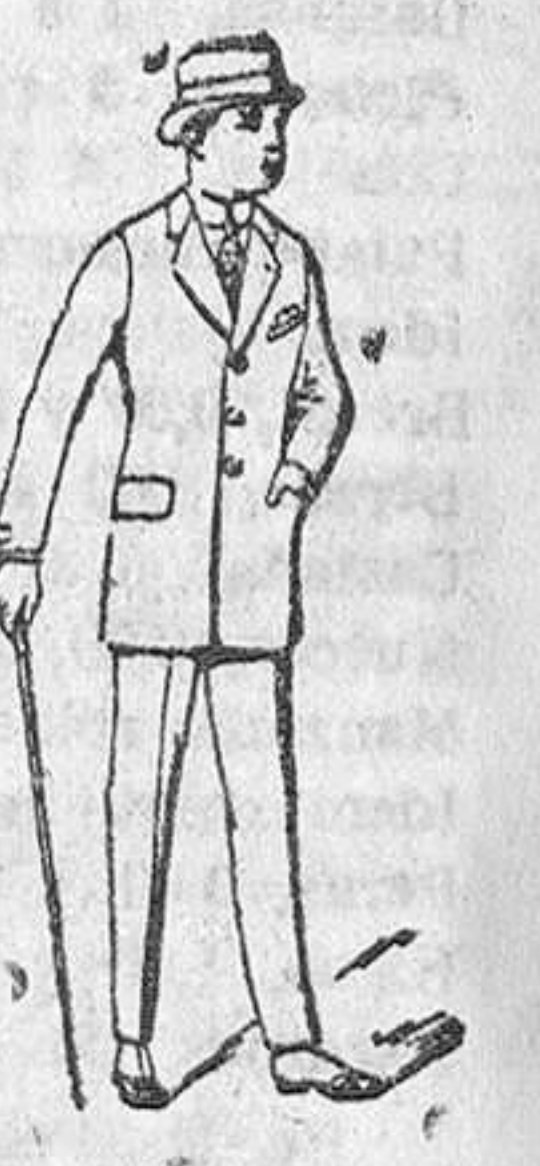
Trejes para caballero de de 40 a 115 pesetas Corte moderno