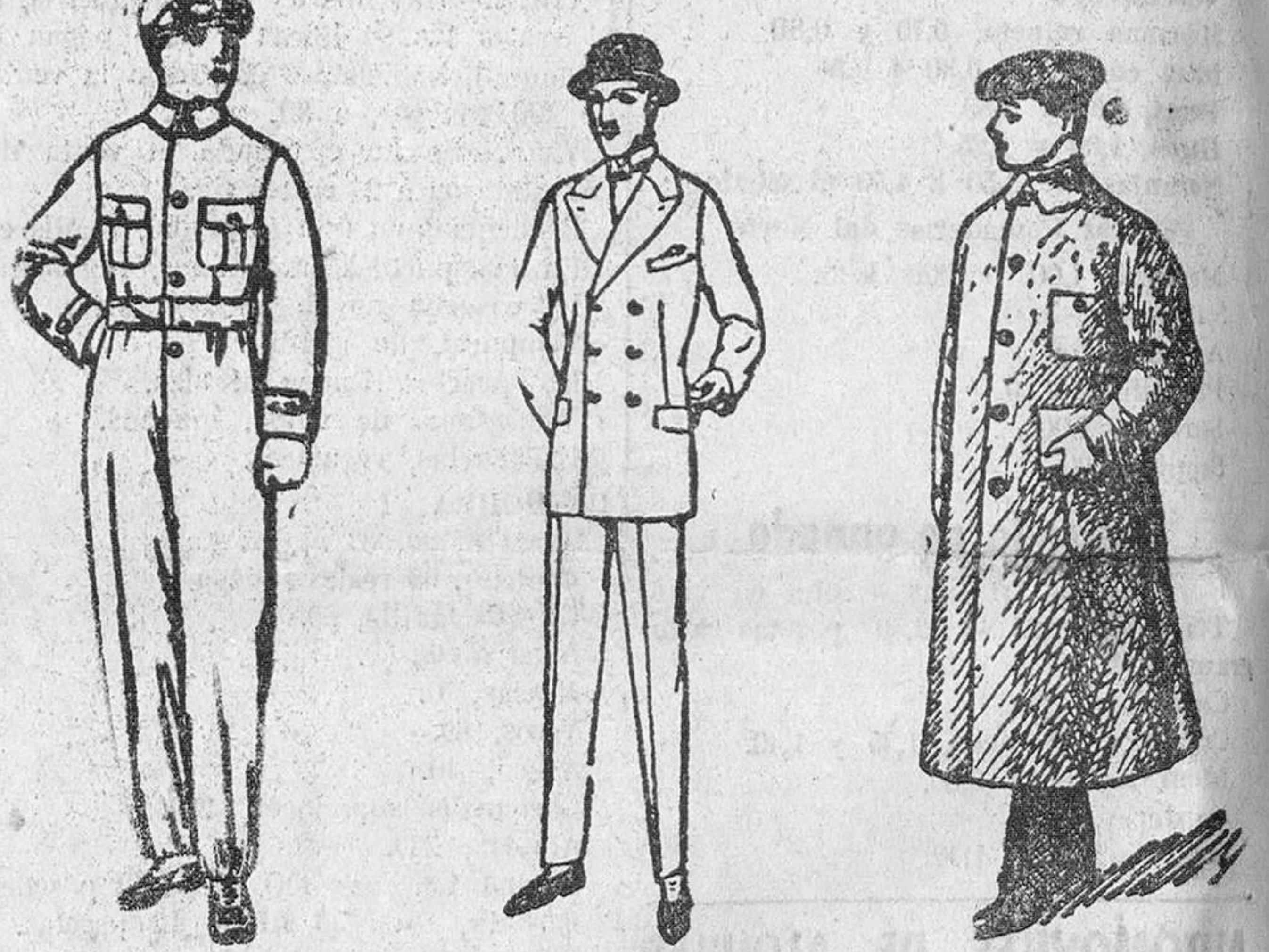
Buzos azules, color kaka y blancos, a 8, 10 y 15 ps Trajes de confección para señores, a 50, 60, 70 y 90 ps