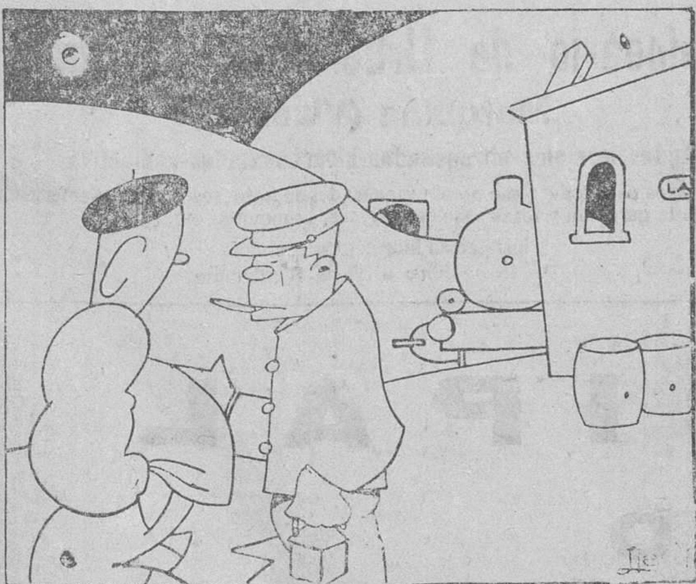
UN VERDADERO TACO

LO MEJOR EN SOMBREROS, GORRAS Y BOINAS PARA CABALLERO Casa Sáiz - Sombrereria, 4