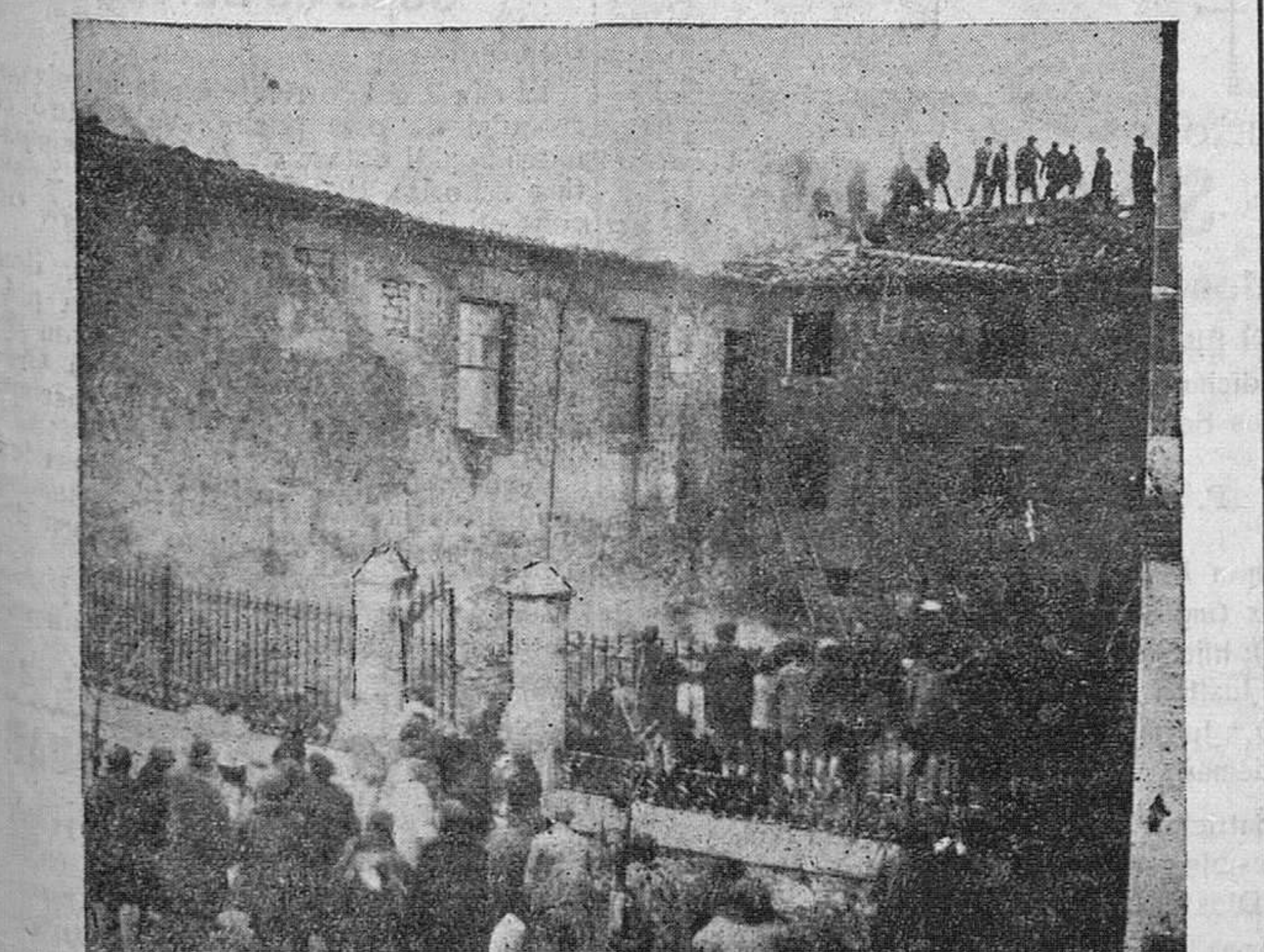
El público trabajando en la extinción del incendio de Lerna.