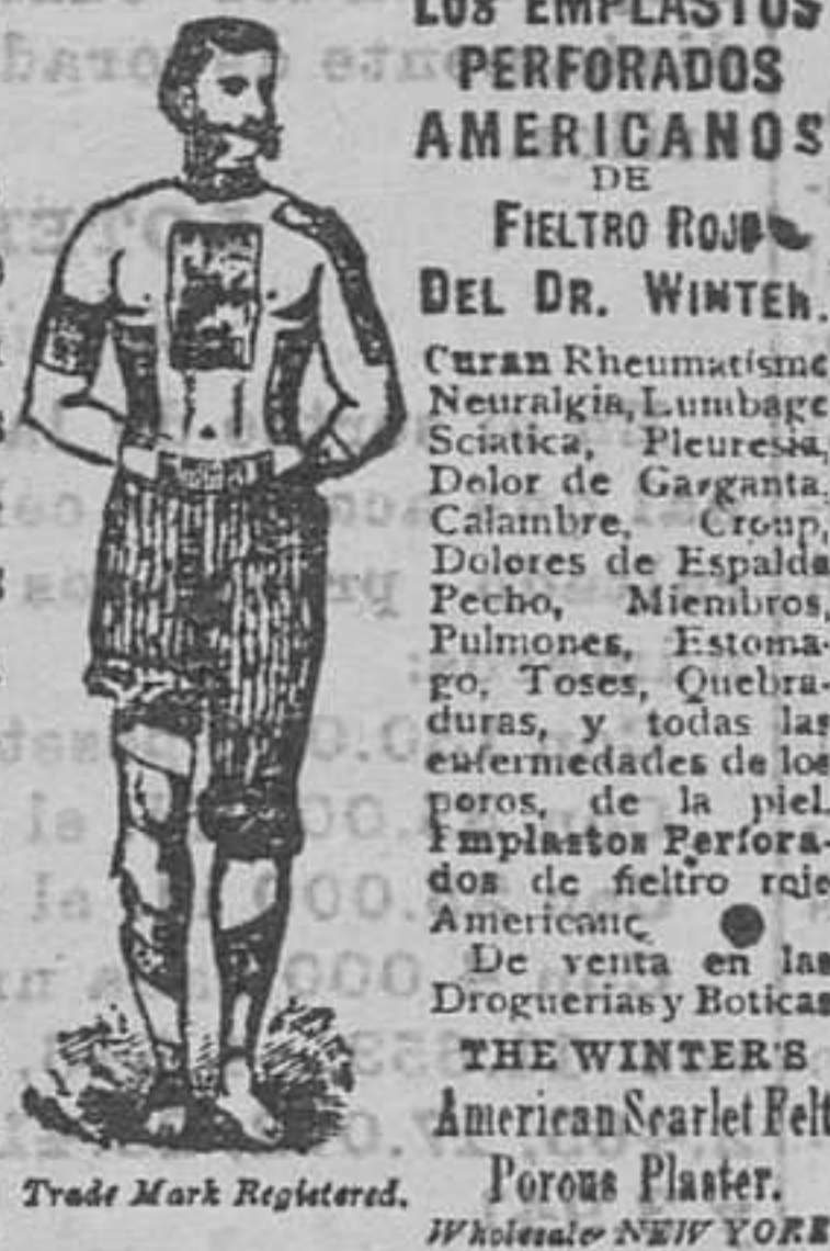
Trade Mark Registered. Poros Plaster. N.Y. N.Y. 1898

Los EEMPLASTOS perforados americanos de fieltro rojo del Dr. WINTER, infunden una saludable corriente eléctrica por todo el sistema, é instantáneamente mitigan los dolores, tranquilizan los nervios, fortalecen los órganos digestivos debilitados y devuelven á los enfermos la salud sin ninguna fé y á menudo á pesar de los temores y las preocupaciones. Estos Emplastos son especialmente útiles para fortalecer los delicados músculos dorsales de las señoras en sus periodos mensuales. Todas las escuelas de Medicina los recomiendan y usan para las curas de las afecciones neurálgicas, reumatismos, debilidades causadas por indiscreciones anticipadas esfuerzos indebidos ó enfermedades de los riñones, pleurías, calambres, punzadas en la espalda, dolores en el pecho que se extienden á los homoplatos y finalmente para todas las enfermedades que resultan de interrupciones en la circulación.