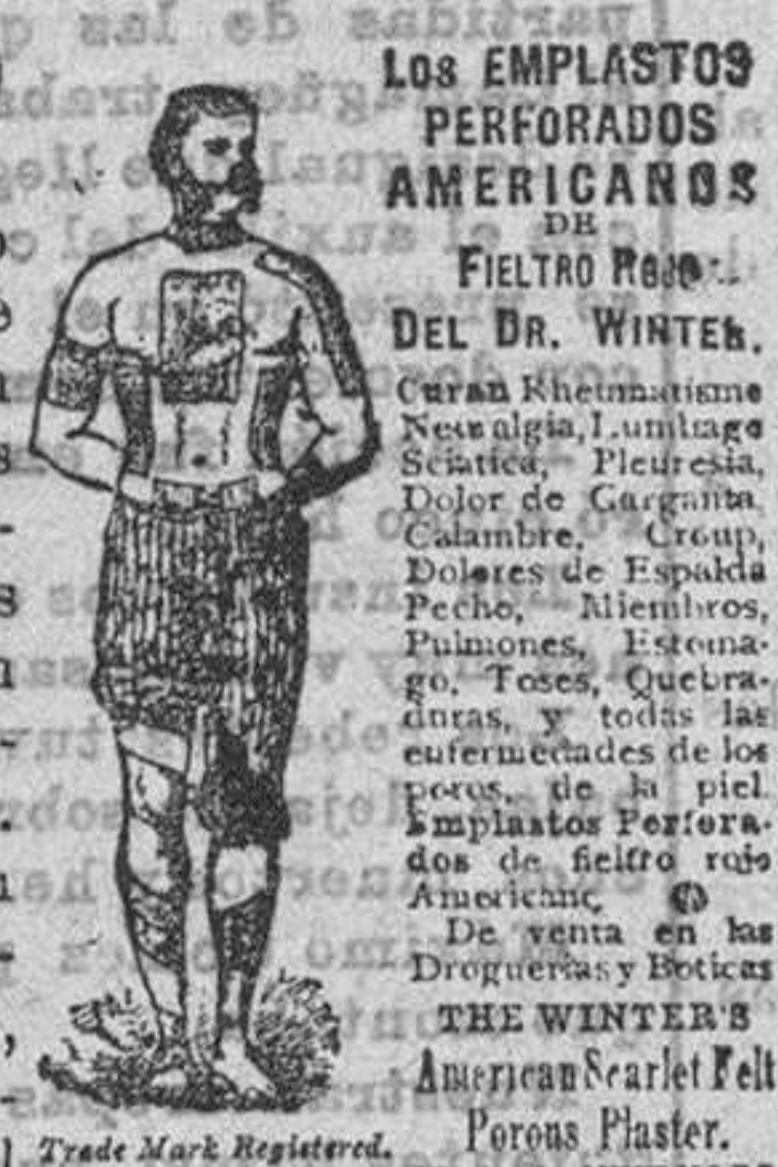
Los EMPLASTOS PERFORADOS AMERICANOS DEL FIELTRO ROJO DEL DR. WINTER . Curan Reumatismo, Neuralgia, Lumbago, Sciático, Neuritis, Dolor de Garganta, Pechos, Alenbrros, Puntiones, Escorpión, Toses, Quelras, etc. En todas las enfermedades de los procesos de la piel. EMPLASTOS PERFORADOS DE FIELTRO ROJO AMERICANO . De venta en las Droguerías y Boticas THE WINTER'S American Pearl Felt Porous Plaster . Trade Mark Registered. Made in New York.

Los EMPLASTOS perforados, americanos de fieltro rojo del Dr. WINTER, infunden una saludable corriente eléctrica por todo el sistema, é instantáneamente mitigan los dolores, tranquilizan los nervios, fortalecen los órganos digestivos debilitados y devuelven á los enfermos la salud sin ninguna fé y á menudo, á pesar de los temores y las preocupaciones. Estos Emplastos son especialmente útiles para fortalecer los delicados músculos dorsales de las señoras en sus períodos mensuales. Todas las escuelas de Medicina los recomiendan y usan para las curas de las afecciones neurálgicas, reumatismos, debilidad causadas por indiscreciones anticipadas, esfuerzos indebidos ó enfermedades de los riñones, pleurías, calambres, punzadas en la espalda, dolores en el pecho que se extienden á los homoplatos y finalmente para todas las enfermedades que resultan de interrupciones en la circulación.