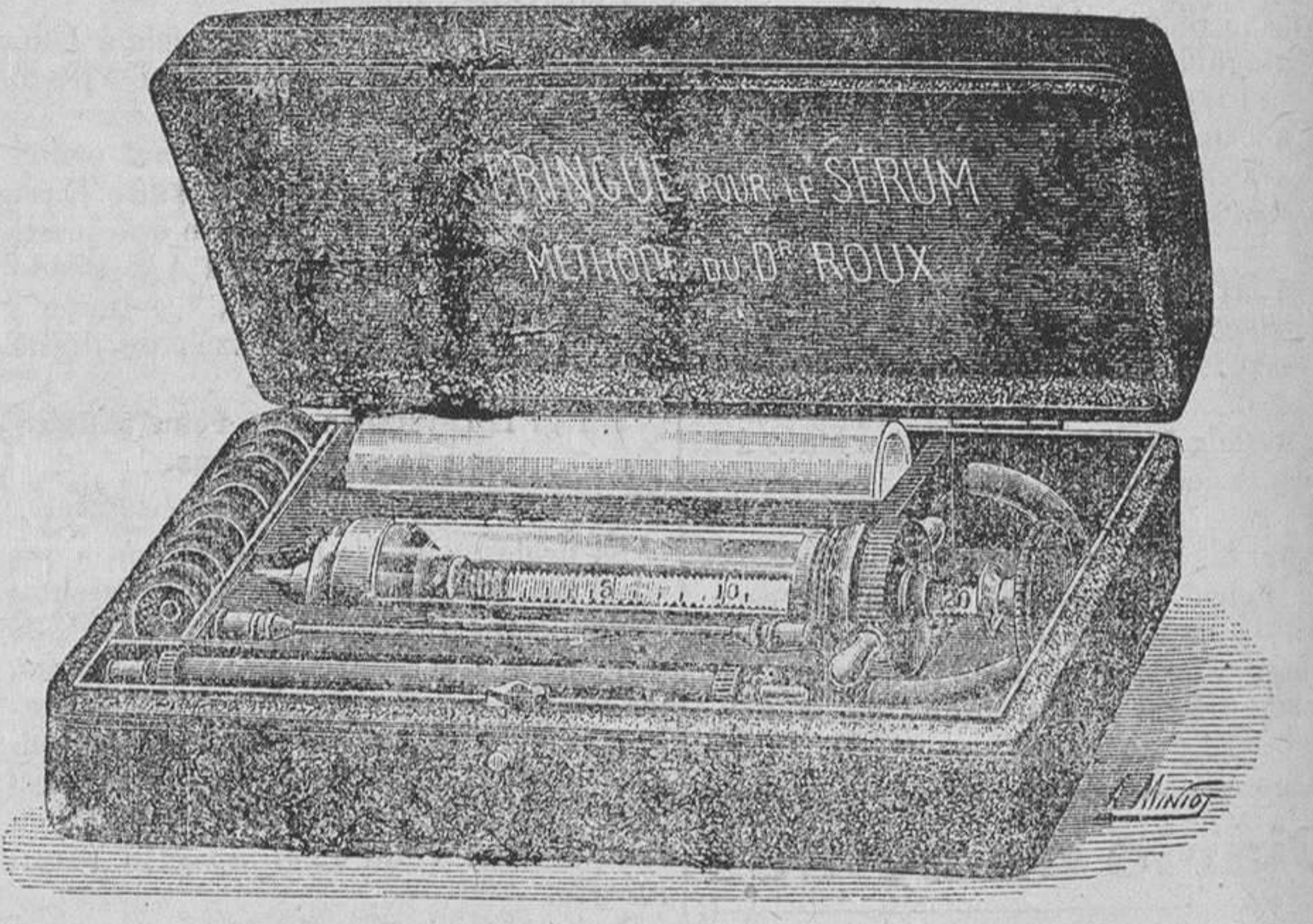
SUERO ANTIDIFTERICO DEL INSTITUTO PASTEUR. Frasco grande, 10 pesetas.—Id. pequeño, 5 id.—Geringas Roux 25 id.

Nutrición completa sin la intervención de las fuerzas digestivas del individuo. Preparado con vino generoso, da tonicidad al estómago y facilita la digestión. Es indispensable á los convalecientes y personas débiles, y todos los que padezcan de inapetencia, gastralgia, dispepsia y anemia, clorosis, úlceras gástricas, catarros, intestinales, tisis, consunción, cuando el estómago no tolera alimentación, y siempre que la digestión se verifica de una manera irregular. Vino de peptonas y hierro.—Peptonas de carne.—Chocolates de Peptonas y Peptonas de leche. Elaboración por medio de vapor y venta por mayor, farmacia de Ortega, León, 13, Madrid Depósito en las principales farmacias de España y Ultramar.