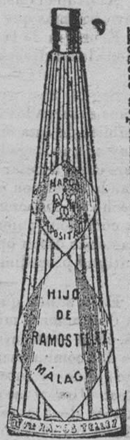
Modelo depositado de la botella de esta casa.