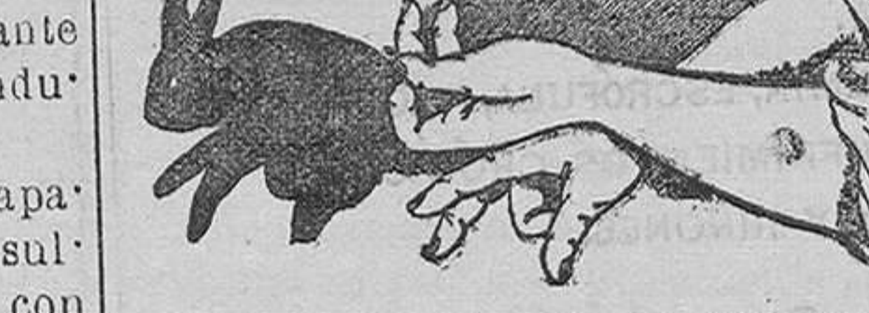
Figura 3.ª.—El conejo.

Colócase, según vemos, una mano sobre otra. El antebrazo derecho en posición horizontal, el codo destacado del cuerpo; el meñique y el anular de la mano derecha, formando una P; los otros tres dedos de la izquierda á lo largo.