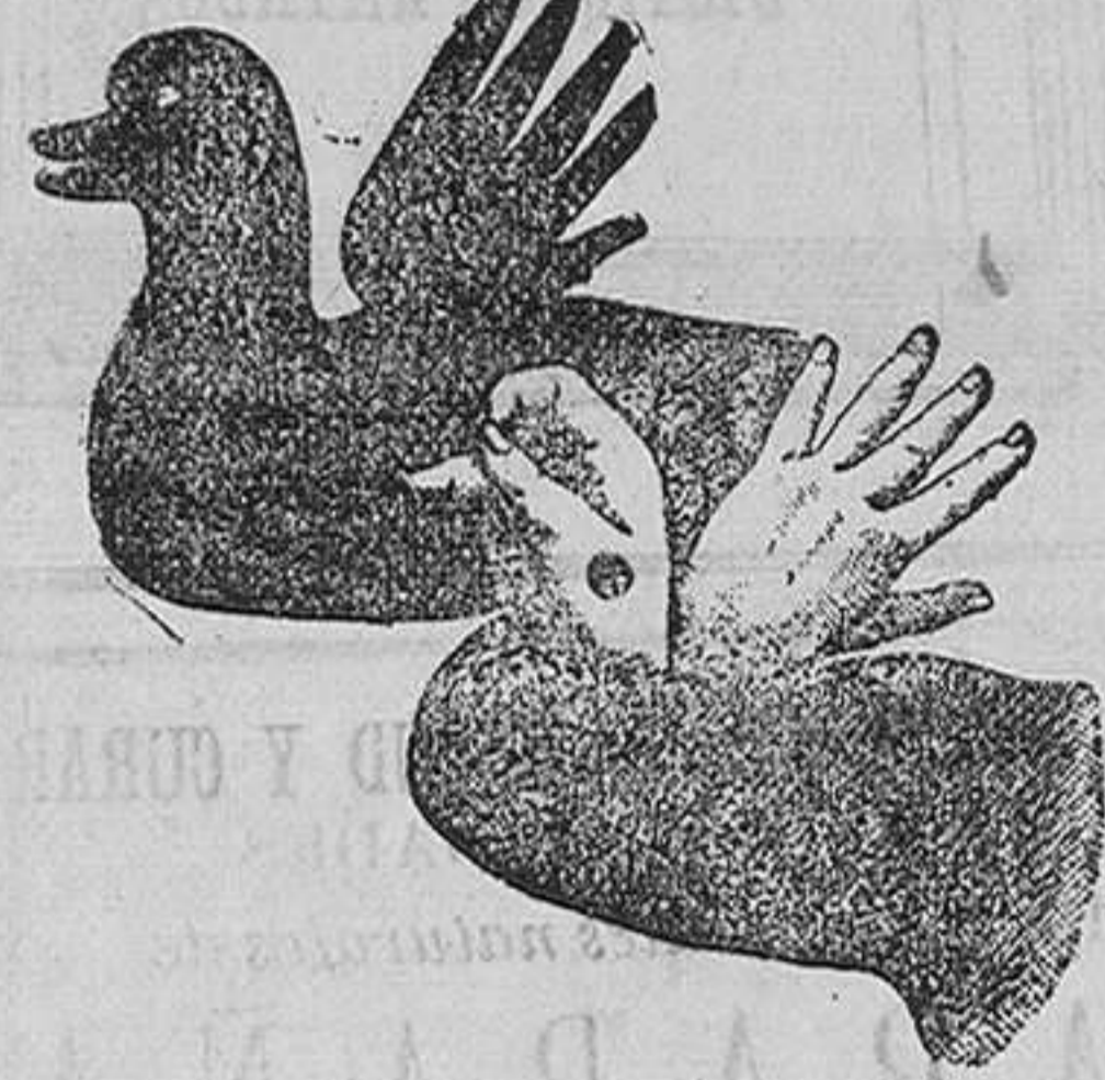
Figura 2.ª—El pato

Para reproducirlo apoyad los dedos medio ó indice de la mano derecha en la yema del pulgar; los otros dos dedos hacia adelante, formando el pico.