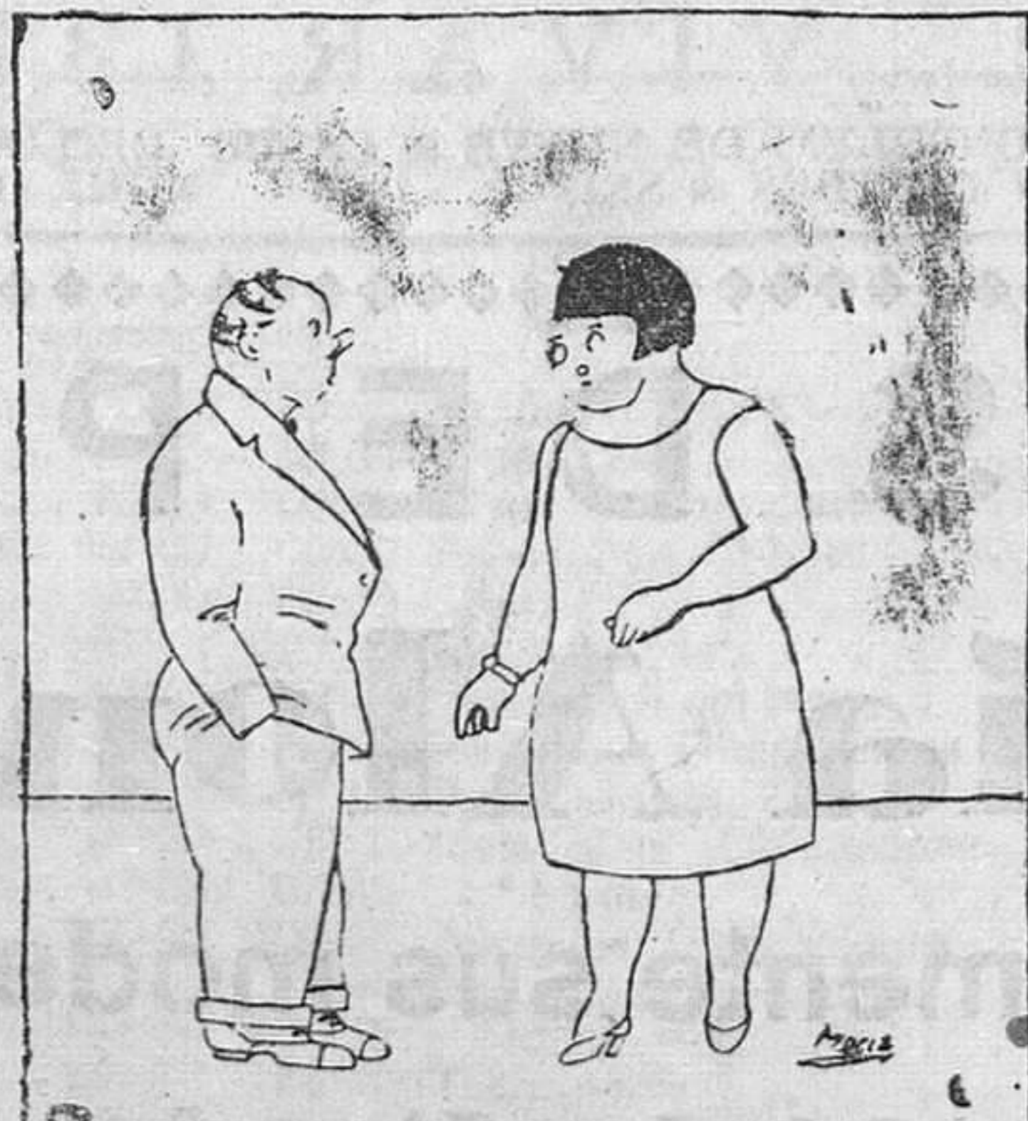
—Tenemos nueve hijos y espero que el otro nos traerá un premio. —¿Por qué? —Porque es décimo.