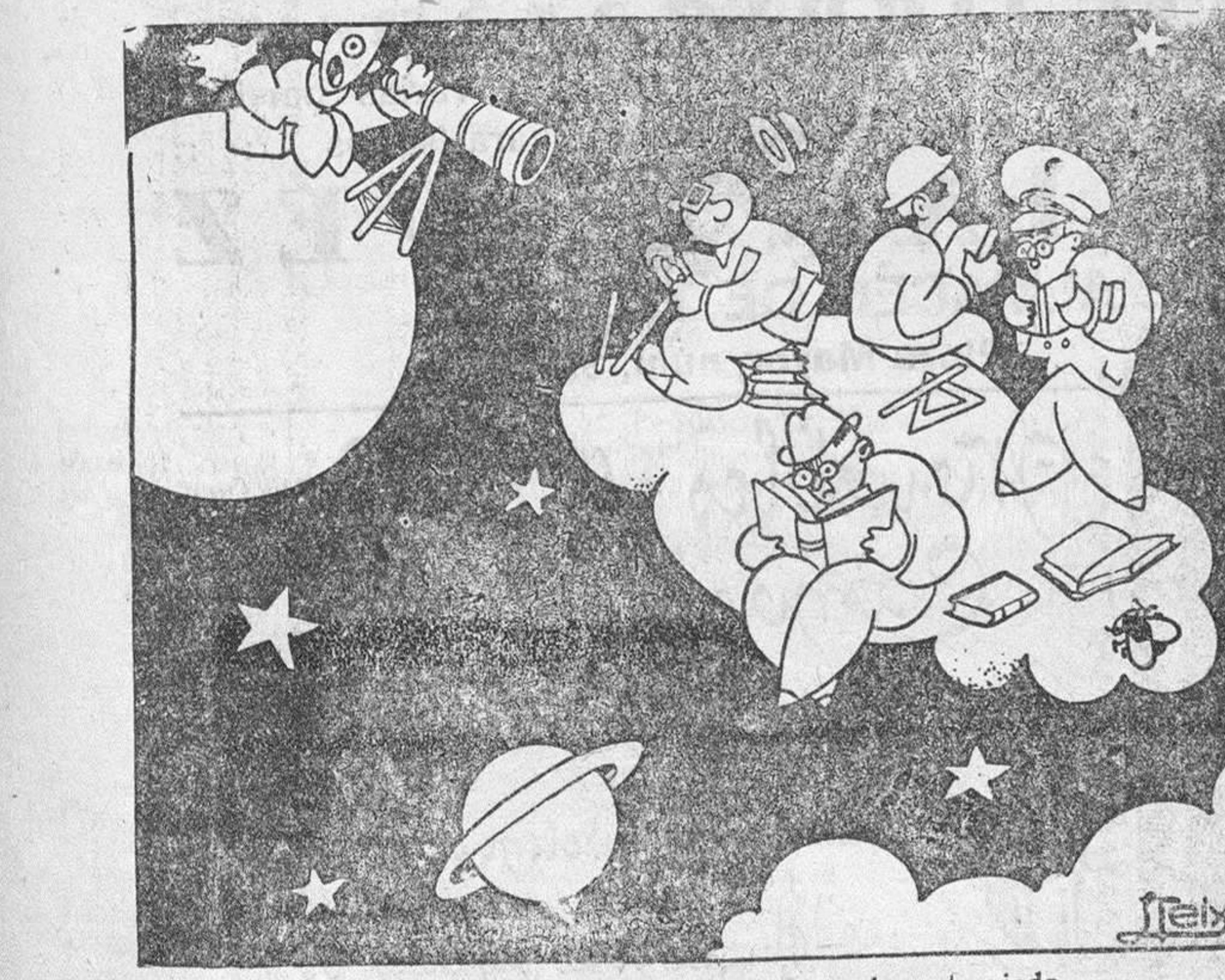
Los sabios andan locos buscando al verano que se ha extraviado.