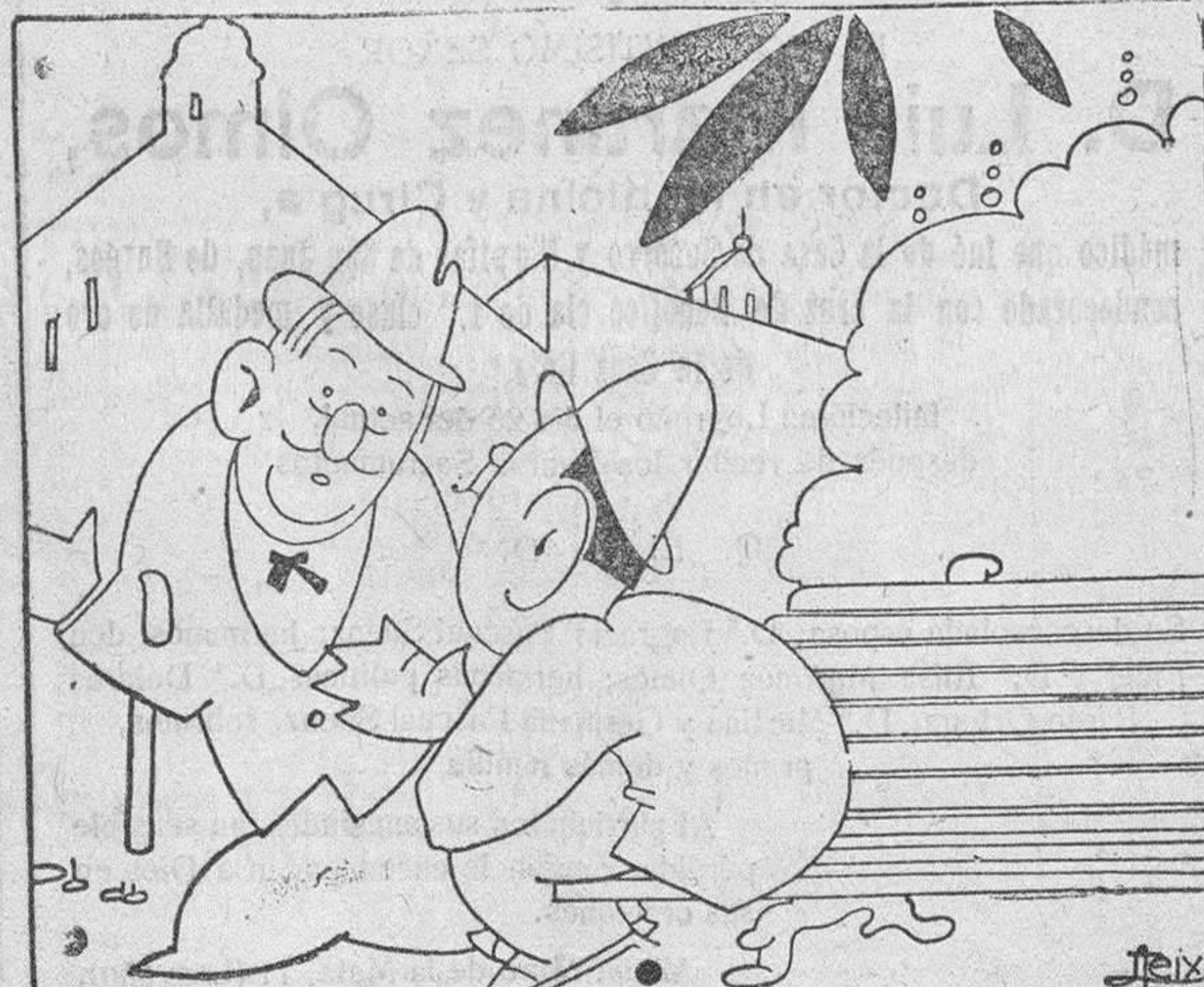
—No comprendo cómo no adelantaron este año la hora. —Pues es sencillo; para que tarden un poco más las elecciones.