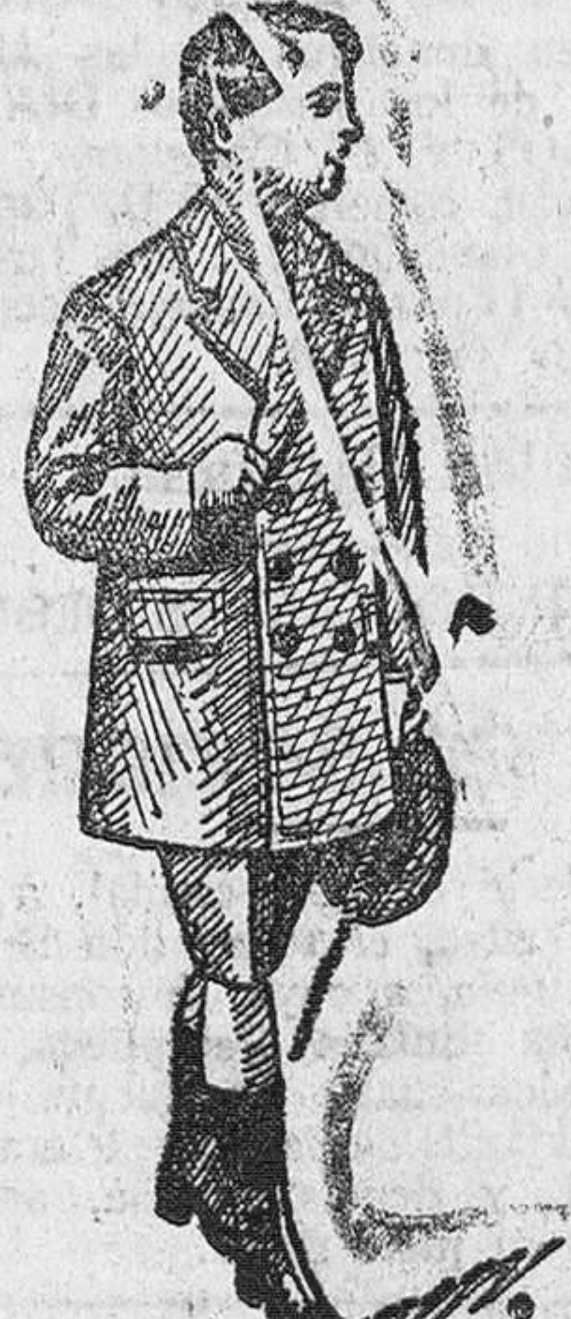
1.000 abrigos para niños, diversidad de modelos, a 16, 20 y 25 pesetas