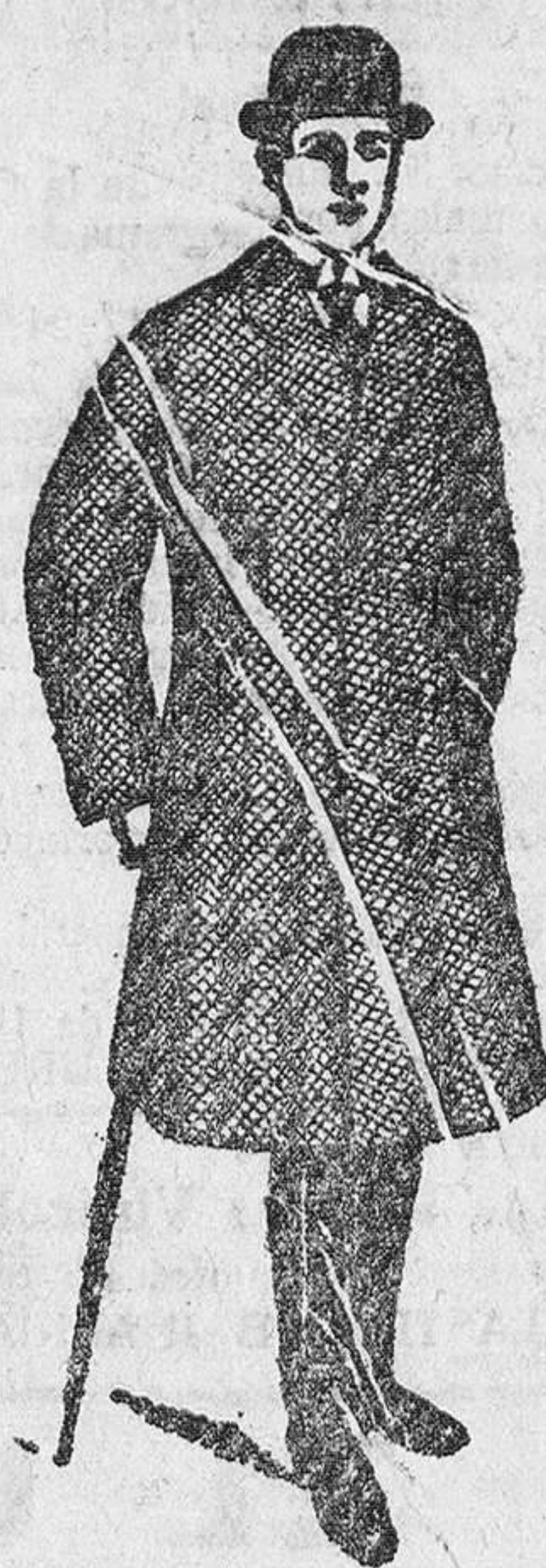
2.000 gabanes para caballero, a 40, 50, 60, 70, 90, 100 y 150 pesetas. Precio fijo verdad. Todos los artículos marcados.