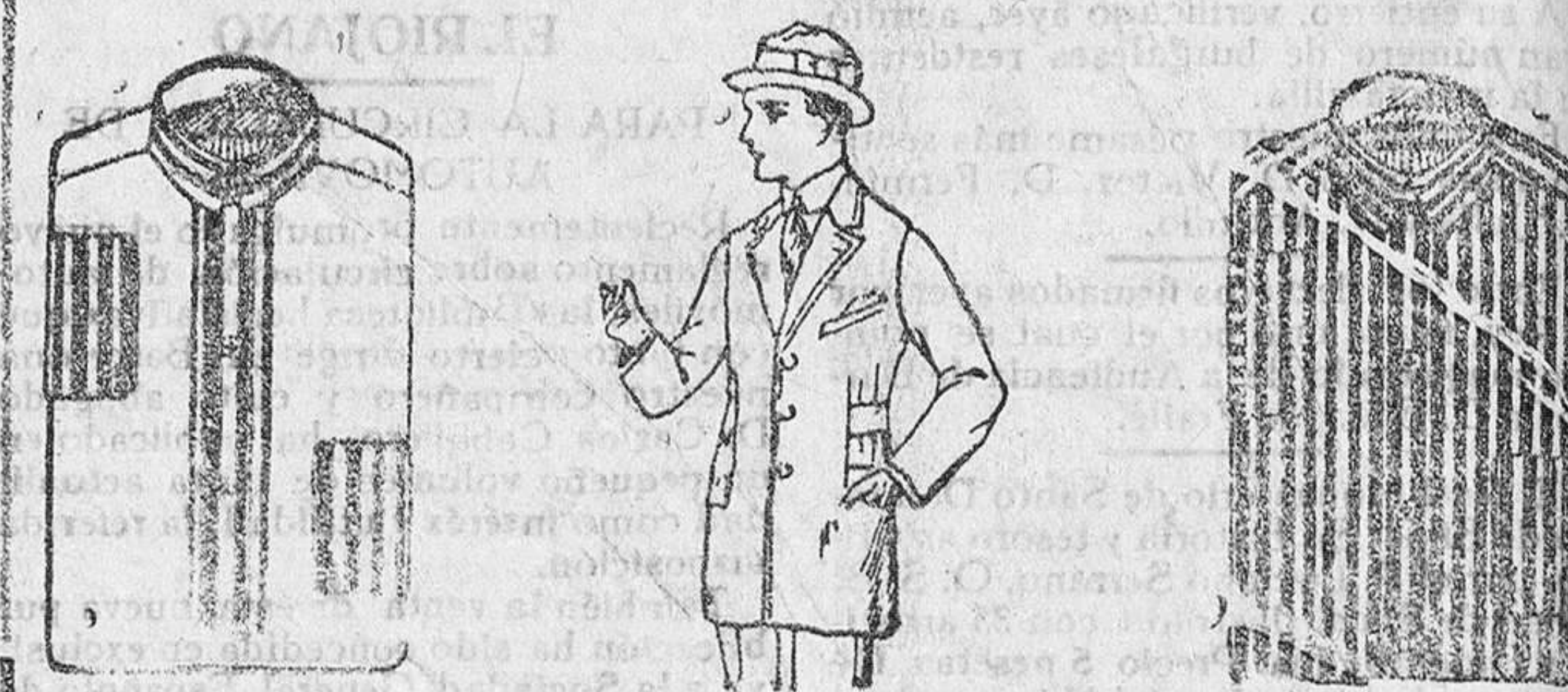
Camisas percal, a 5 y 6 pesetas. Americanas novedad en punto y rombo, a 45, 50, 60 y 70 pts. Camisas otomán seda, a 9, 10 y 12 pesetas. Todos los artículos marcados