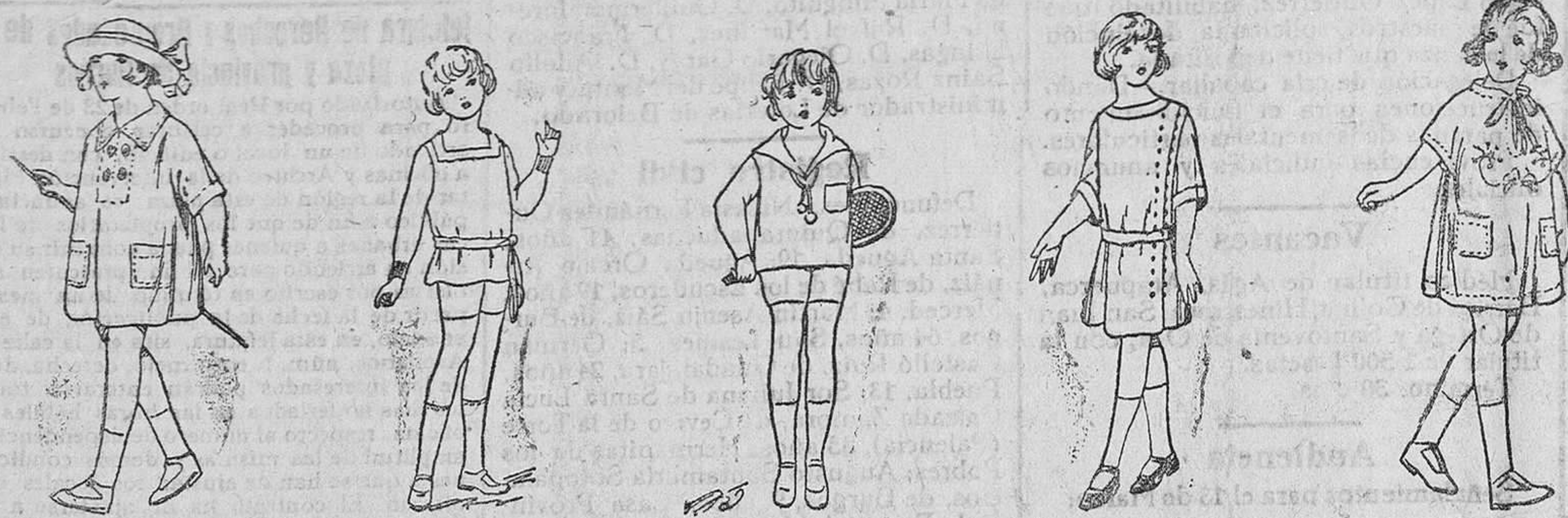
300 modelos diferentes en vestidos y trajecitos para niños, en percal, batista, hilo y seda, desde 2'50 pesetas vestido a 35