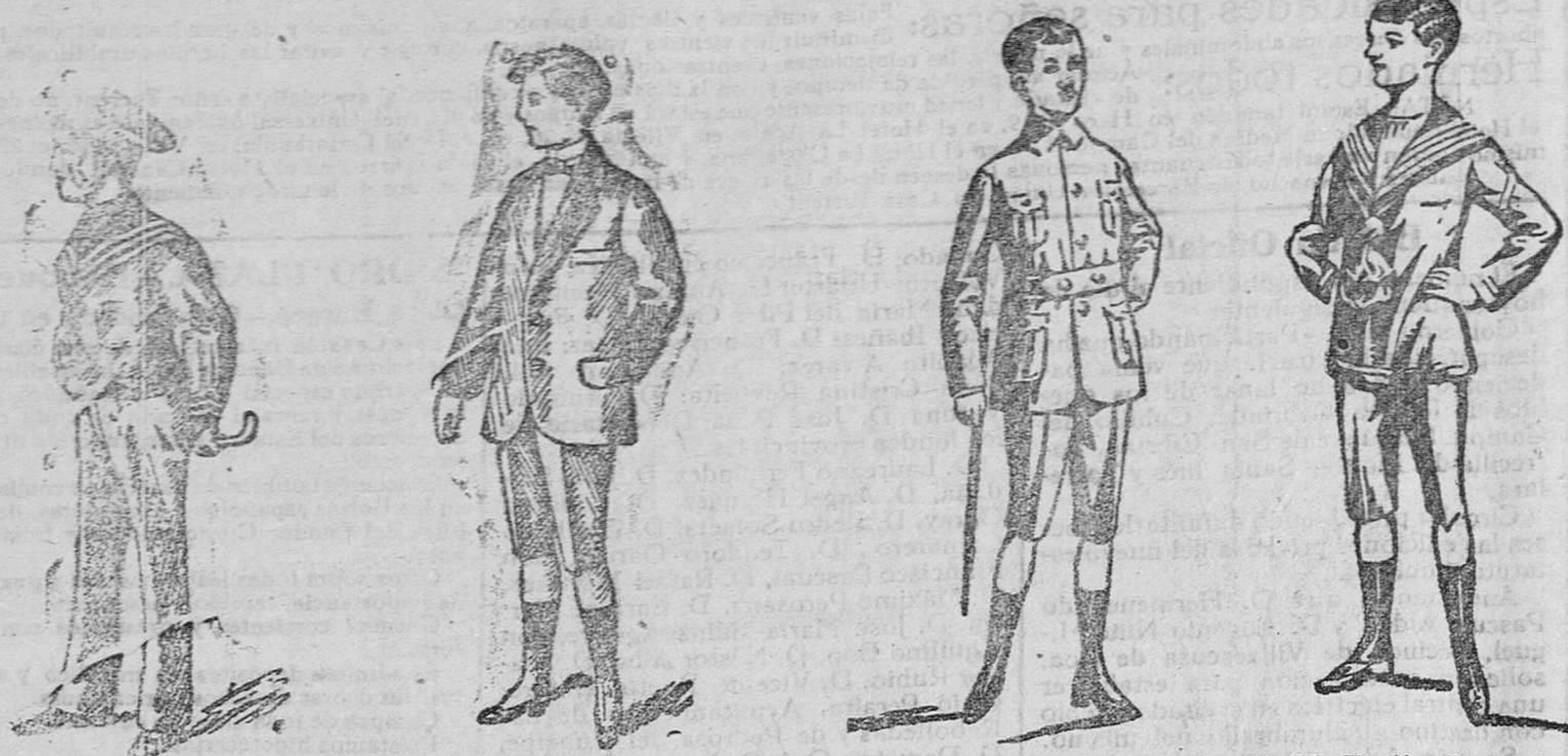
Modelos de trajecitos en diferentes formas y estilos para primera comunión y formas de sport, a 20, 25, 30, 40 y 50 pesetas.

Gran casa de tejidos, pañería y confecciones de caballero, señora y niños