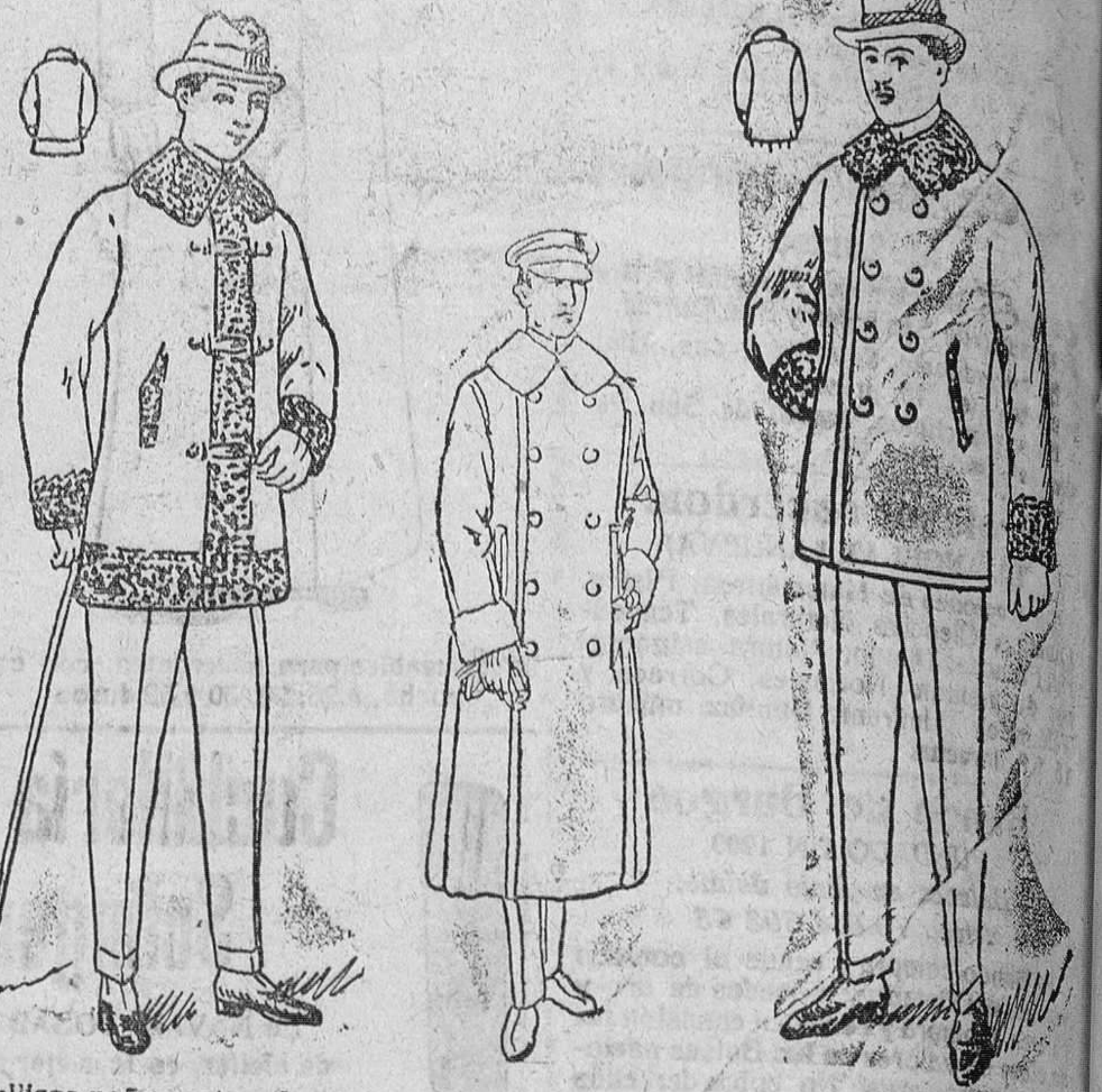
Pelizas paño castor, de rizo alrededor, desde pesetas 50 á 90. Guardapolvos de sofer, desde 20 á 30 pías. uno. Pelizas paño melton, cuello y bocamangas rizo, desde 15 y 60 pesetas.

Primera casa en confecciones de caballero, señora, niños y niñas