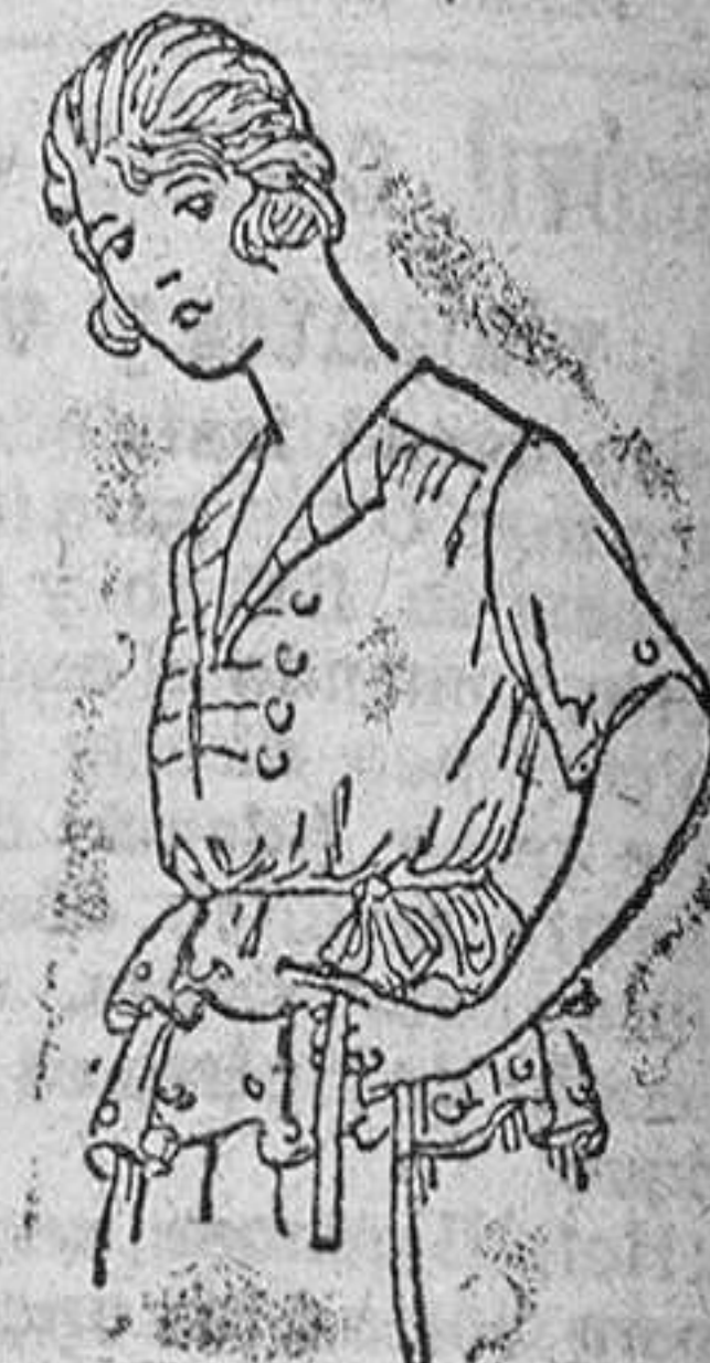
Gerseys lana, en colores novedad, á 15, 18, 20 y 25 pts.