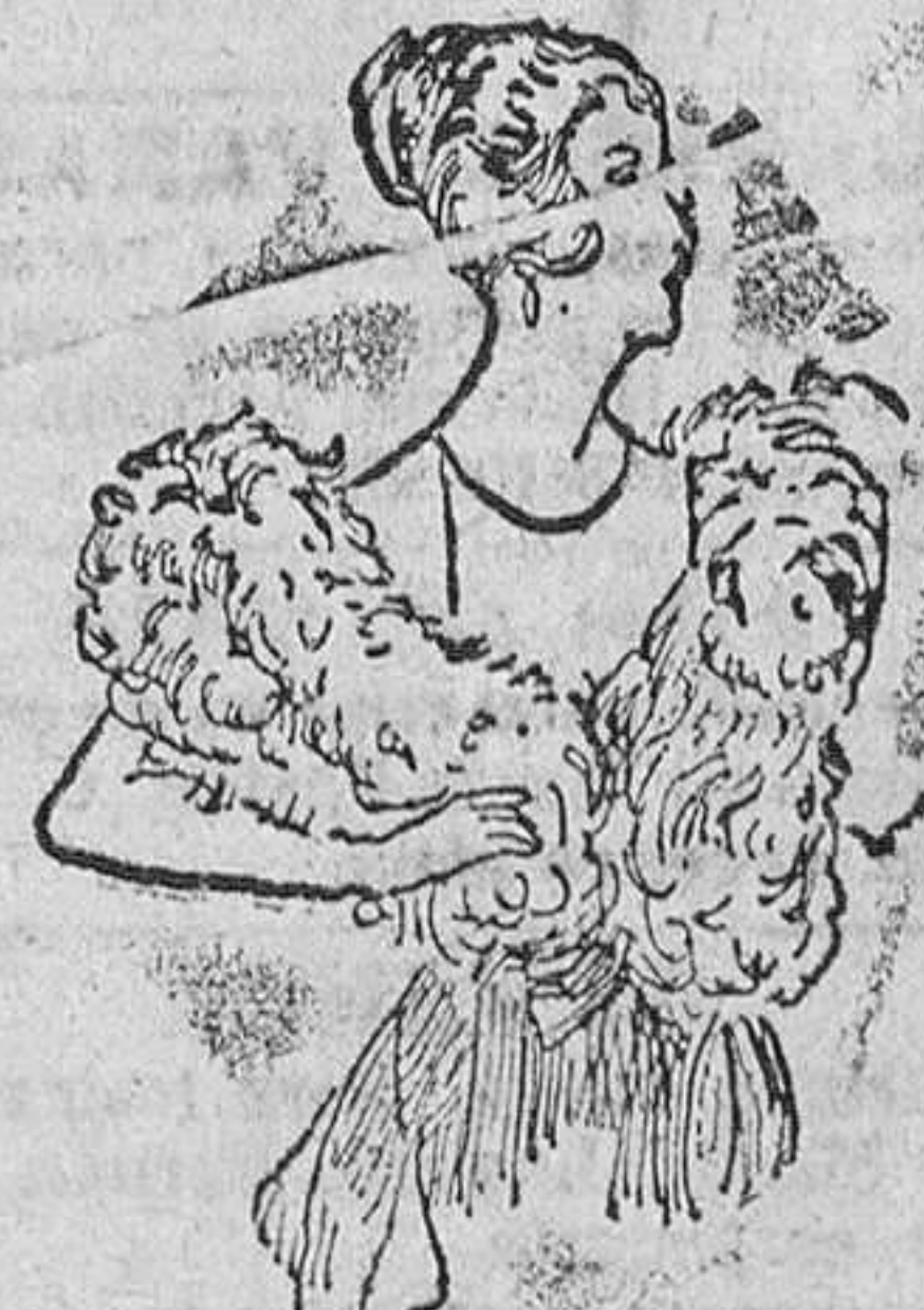
Cuellos de pluma «Saldo» desde 25 á 65 pts.