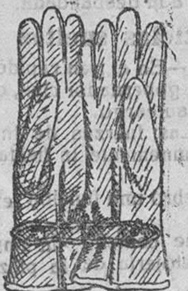
Gautes piel con forro lana, a 10, 15, 20 y 25 pesetas.

Depósito de las sandalias 'Paco', con piso de goma, propias para invierno, y de las máquinas de escribir NOISELESS, completamente silenciosas.