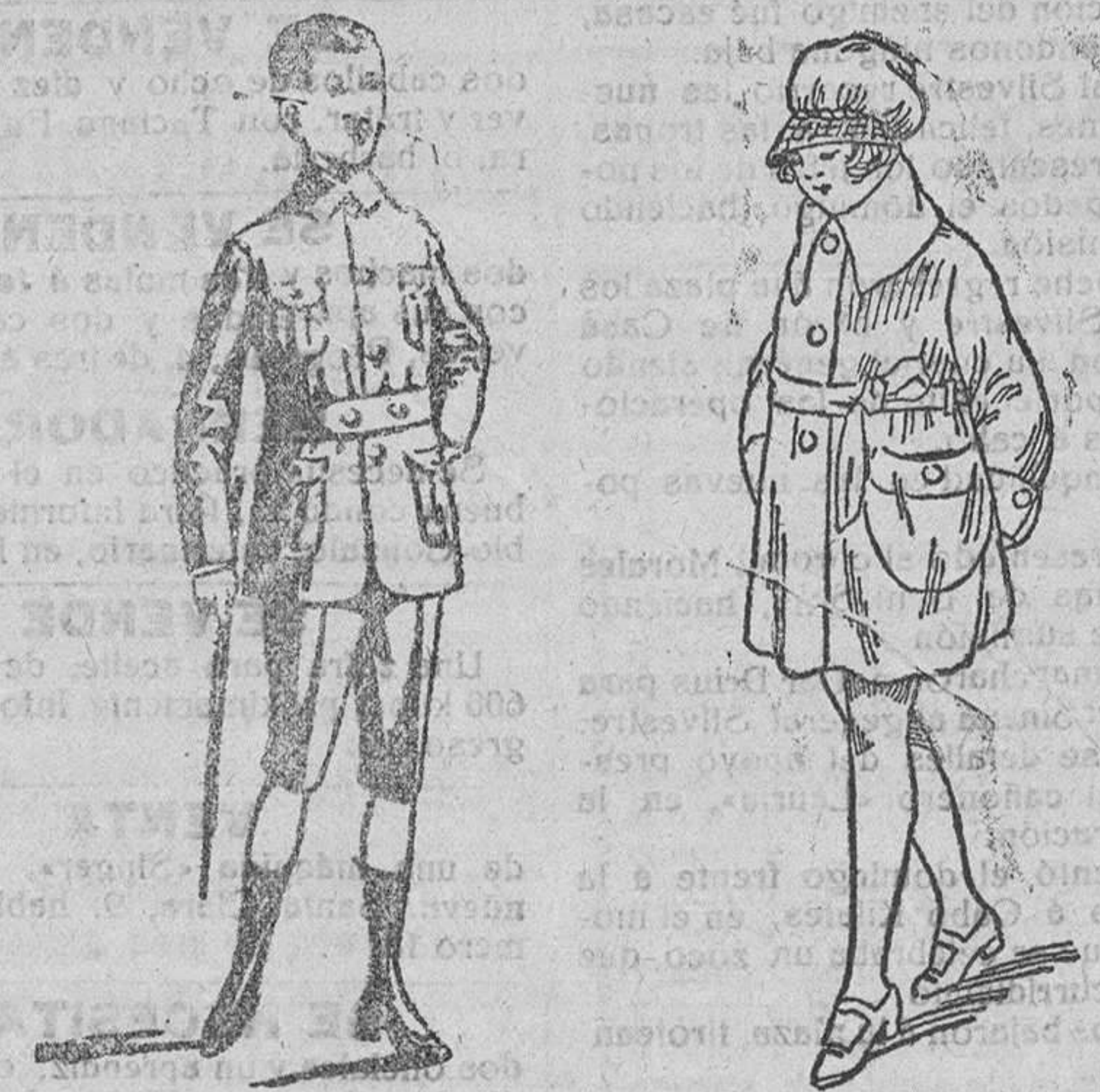
Trejecitos paño, forma sport, a 25, 30, 35 y 40 pts.

Plaza Mayor, 42, y Lain-Calvo, 9.—Teléfono núm. 88.—Burgos PRIMERA CASA EN CONFECIONES