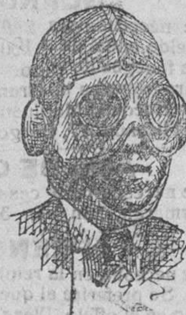
Cascos para motoristas a 5 pts. Gafas, 5 50