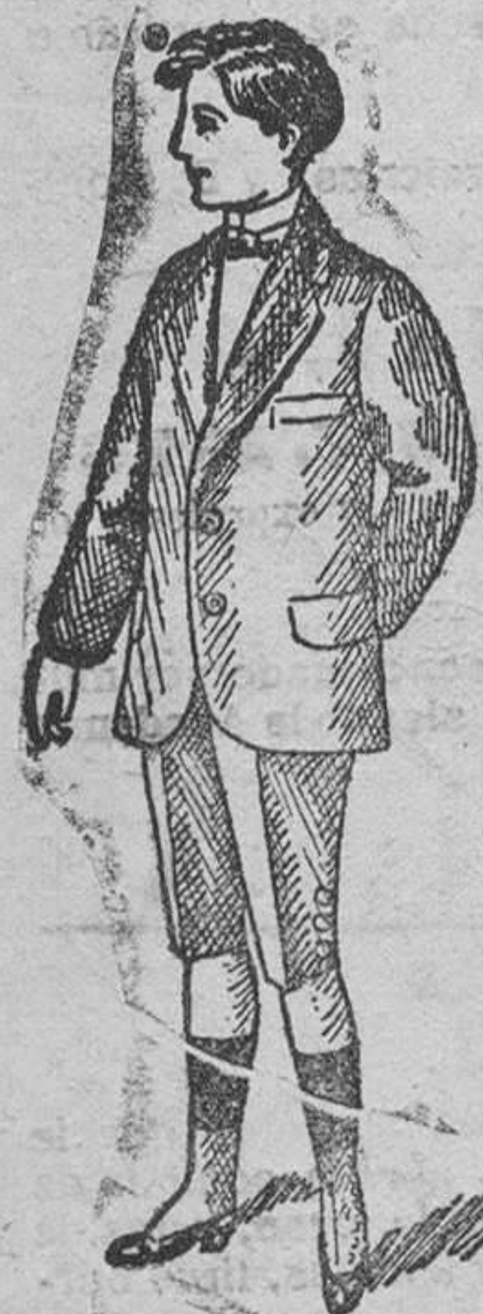
Trajecito para joven á 35, 40, 50, 60 y 70 pesetas.