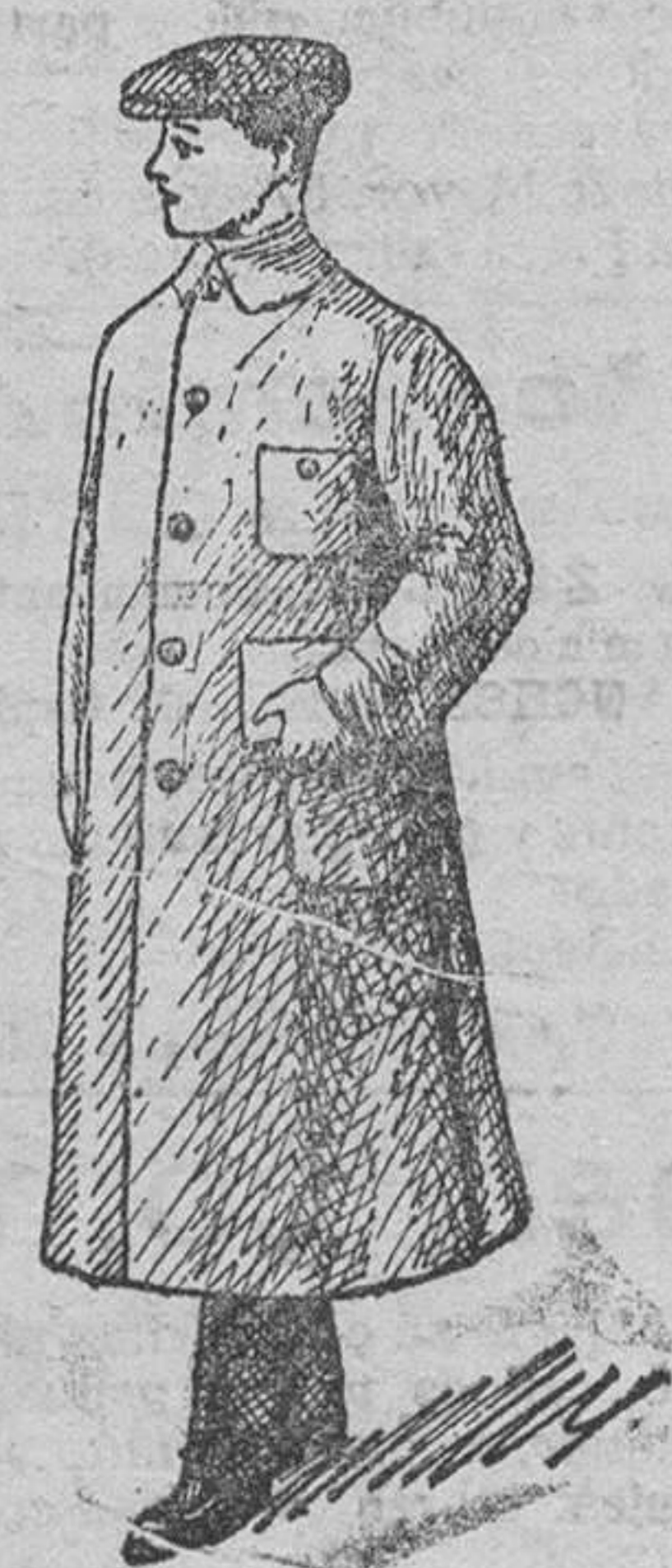
Guardapolvos caballero á 12, 15, 18, 20 y 25 pesetas.