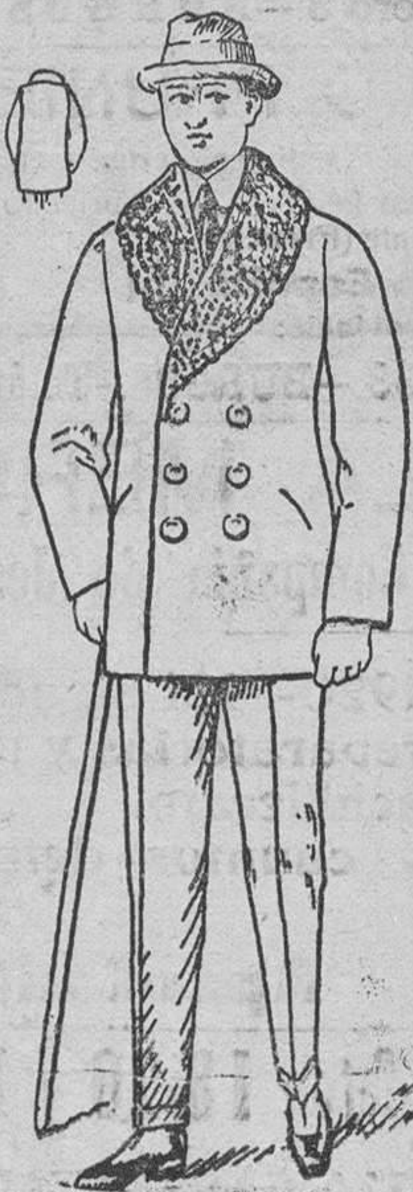
Peliza paño arasado, con piel ó rizo en el cuello, á 40, 50, 60 y 70 pesetas.