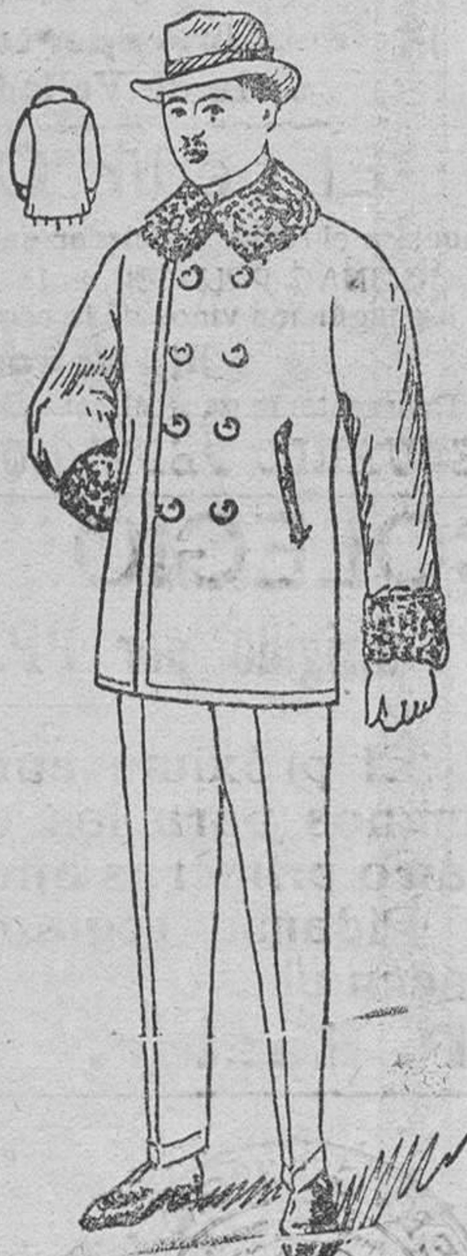
Peliza paño melton, con rizo en el cuello y puños, á 25, 30, 40, 50 y 60 pesetas.