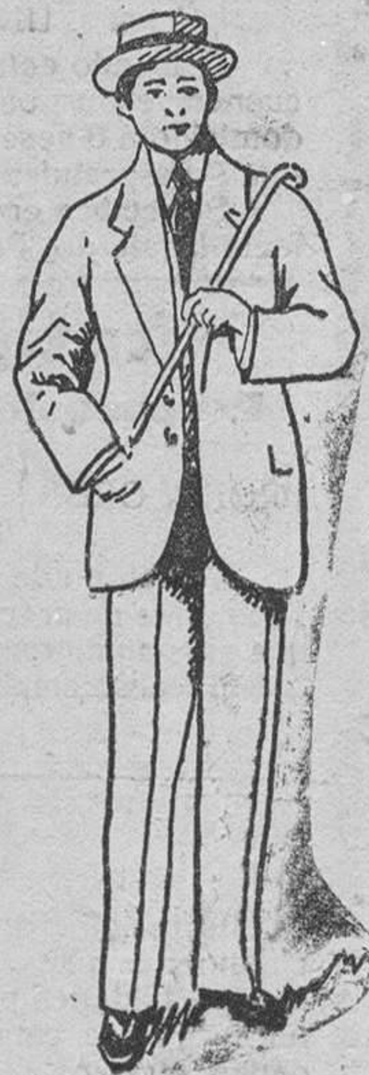
Traje paño melton á 45, 50, 60, 70 y 90 pesetas.