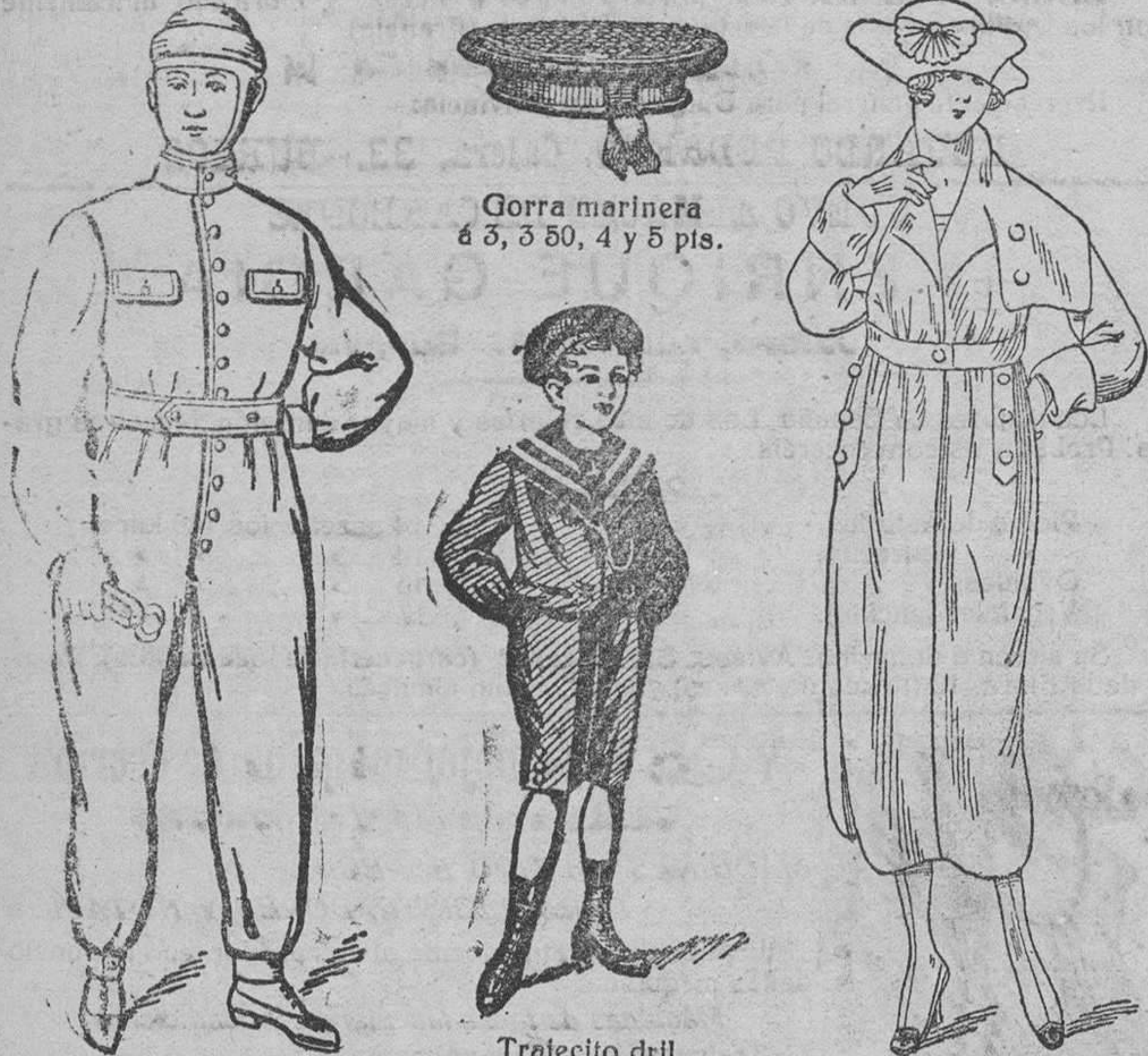
Gorra marinera a 5, 3 50, 4 y 5 pis.

Plaza Mayor, 42, y Lain-Calvo, 9.-Teléfono núm. 88.-Burgos