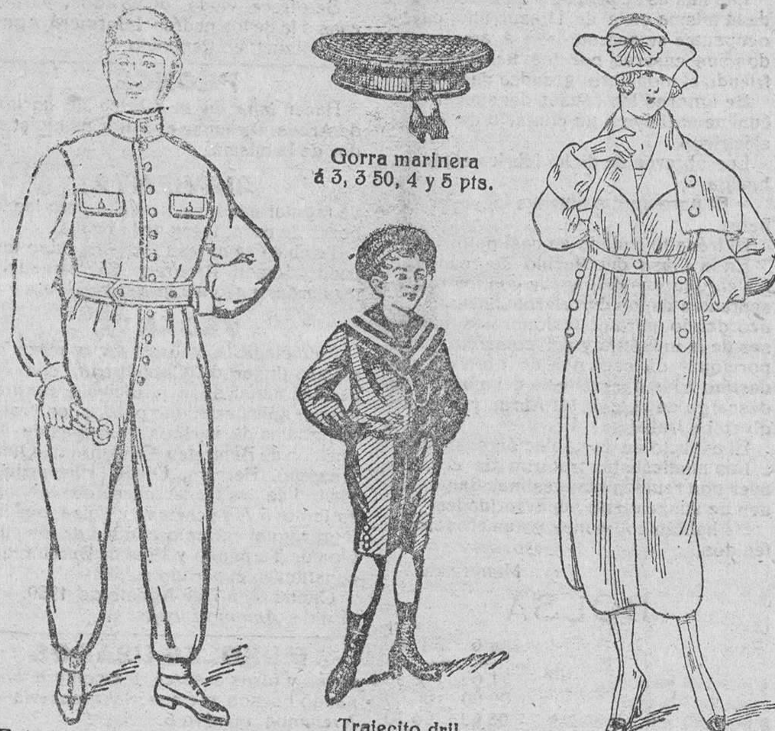
Gorra marinera á 3, 3'50, 4 y 5 pts.

Plaza Mayor, 42, y Lain-Calvo, 9.-Teléfono núm. 88.-Burgos