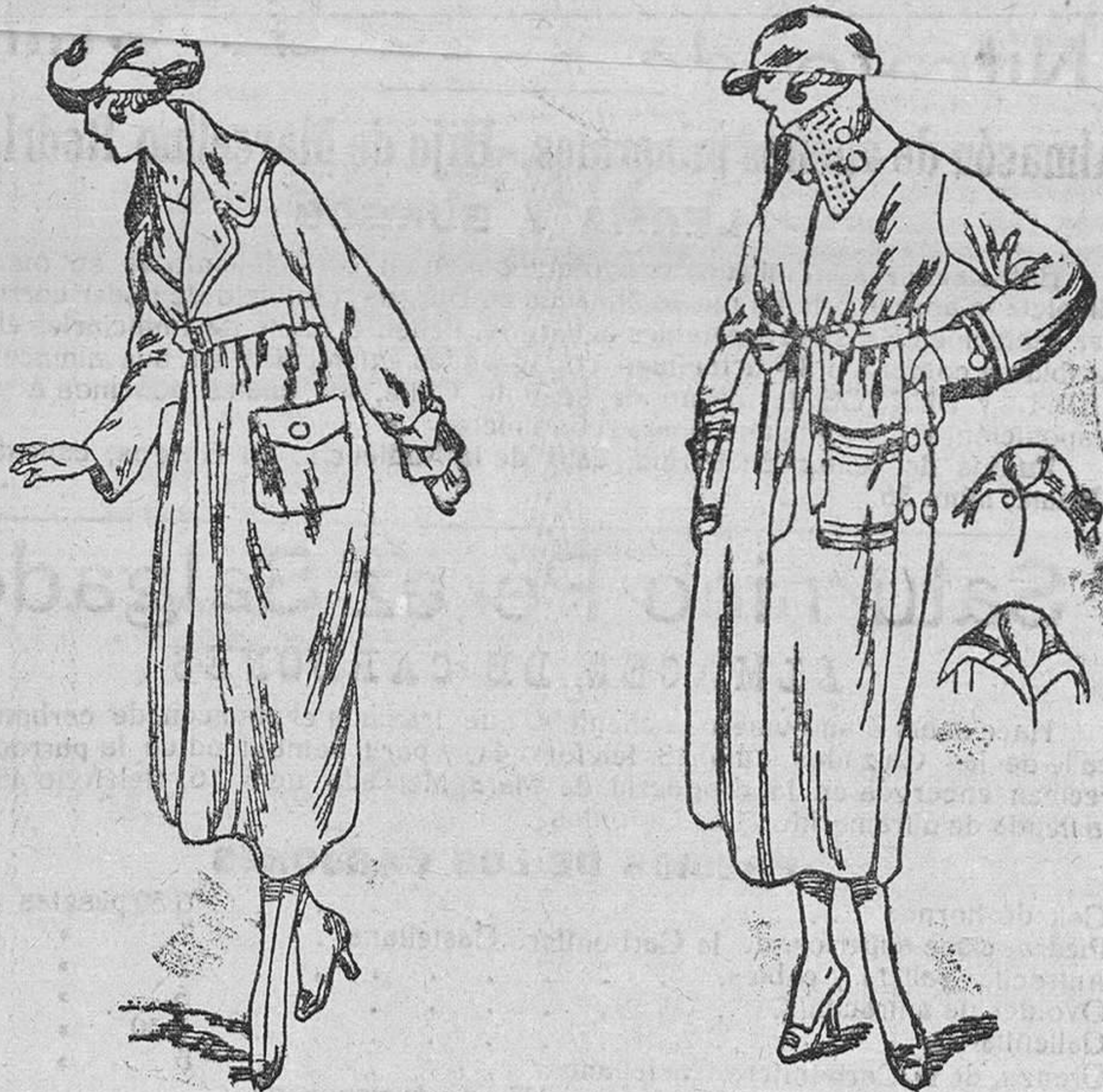
Dos nuevos modelos en Impermeables de señora, en negro y color, desde 35, 40, 50, 60 y 75 pesetas.

Plaza Mayor, 42, y Lain-Calvo, 9.-Teléfono núm. 88.-Burgos