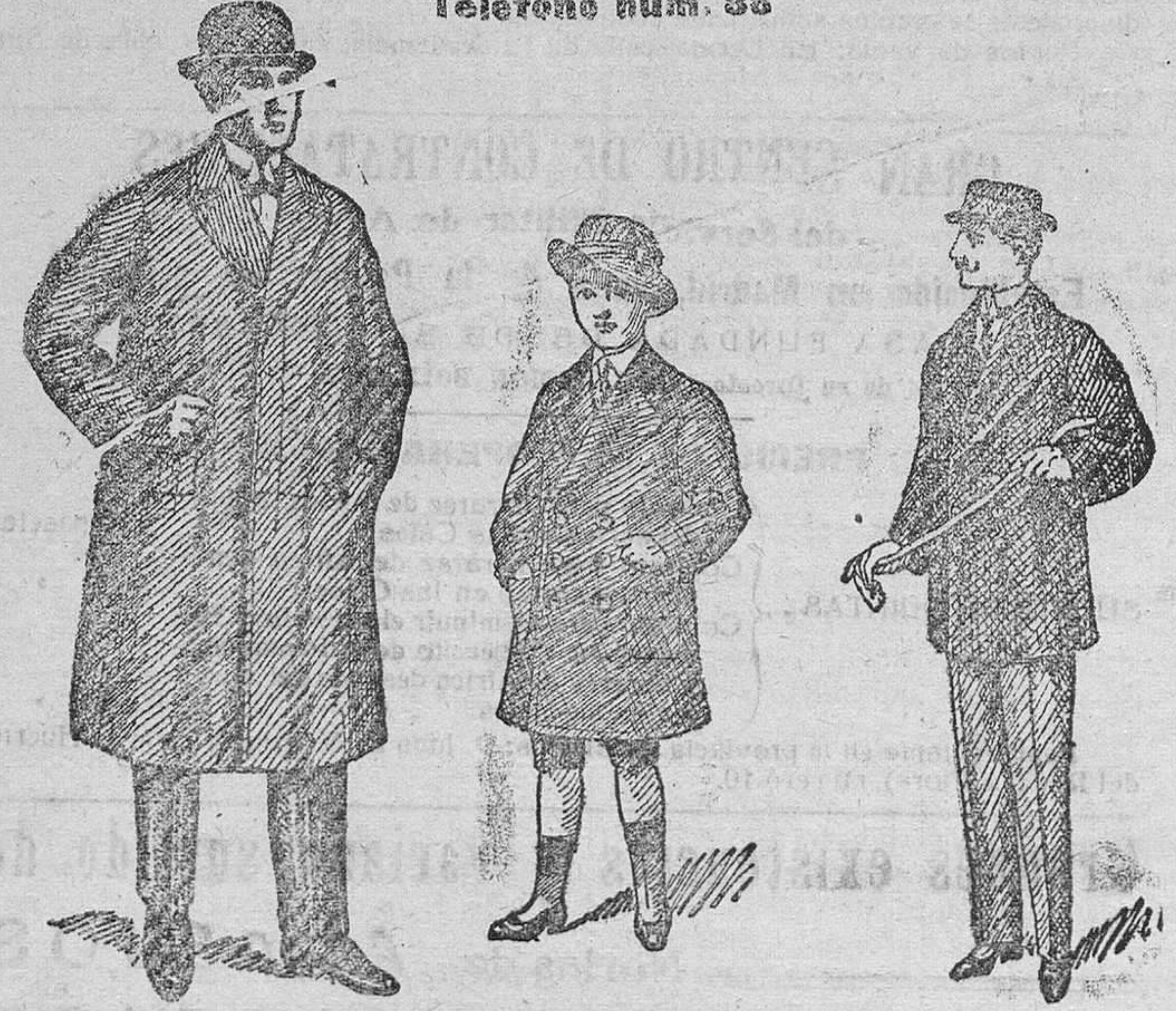
Gabanes de caballero y jóvenes, desde 40 a 125 pesetas. Siempre últimas novedades. Gabanes para juveniles a 25, 30, 35, 40 y 50 pesetas. Pellizas desde 18 a 75 pesetas. Grandes surtidos.

Plaza Mayor, 42, y Lain-Calvo, 9.-Sucursal: Paloma, 6.-Burgos Esta casa acaba de recibir grandes remesas en gabanes, pellizas, mantones, tapabocas, capas, mantillas de seda, pasamontañas, capotes para el campo, impermeables negros y color para militar y paisano. Siempre a precios económicos - Precio fijo Teléfono núm. 33